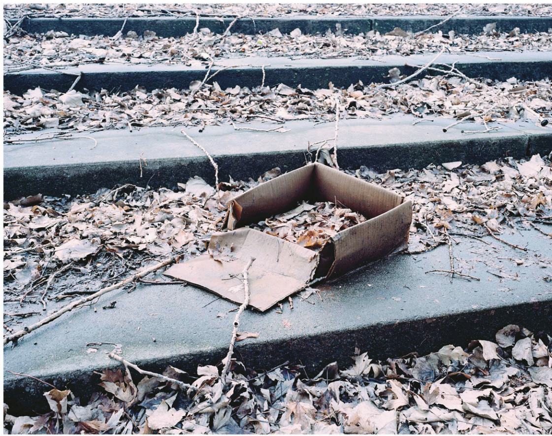
Pascal Grandmaison, Univers parallèle , 2017

De loin, l'effet est déjà saisissant, mais dès que l'on s'ap-