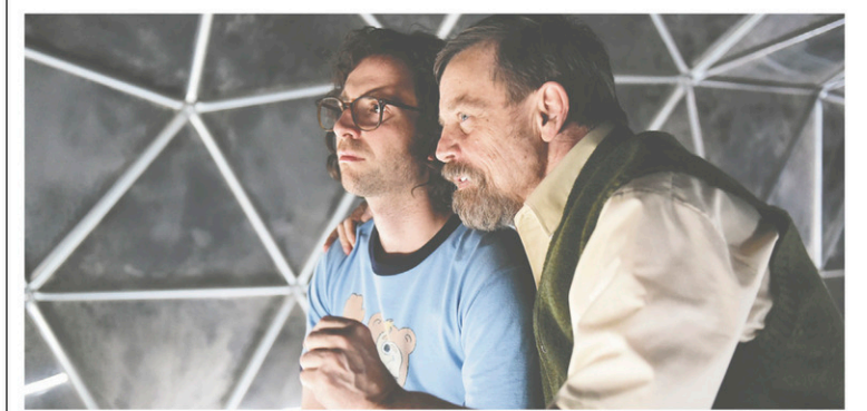
Kyle Mooney et Mark Hamill dans une scène de Brigsby Bear