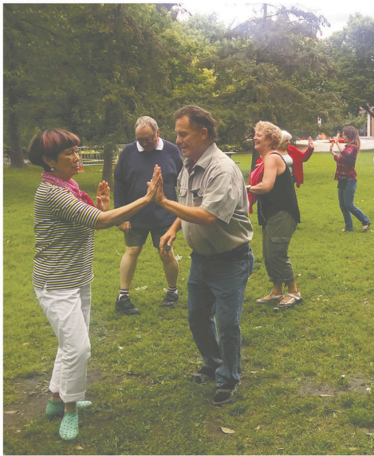
Quartiers Danses multiplie les ateliers de danse contemporaine, les disséminant sur toute l'année, en divers lieux

« Cette année, on s'est vraiment concentrés sur les personnes qui vivent avec une déficience intellectuelle et motrice