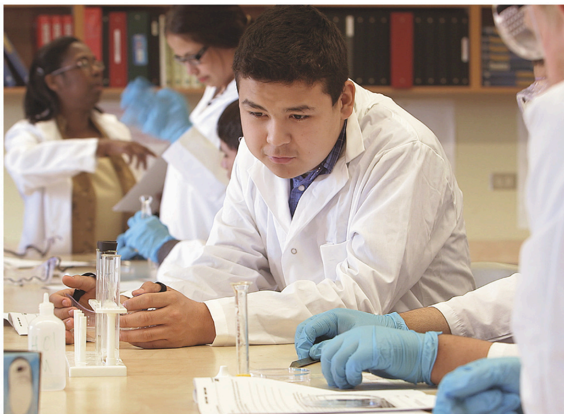
Une scène du film d'Alanis Obomsawin, Our People Will Be Healed , son 50 e film en 50 ans, qui sera présenté en grande première au TIFF de Toronto.