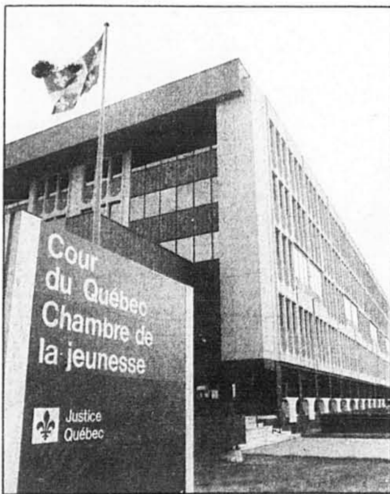
Vers 9h30, les juges font leur entrée...