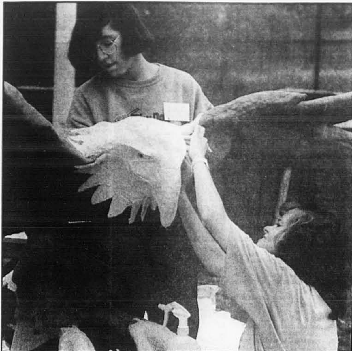
L'équipe de l'Association québécoise des gardiens d'animaux de zoo travaille sur un aigle à tête blanche, cet emblème des États-Unis qui est menacé d'extinction.

■ Un désespéré a tenté à plusieurs reprises, vendredi à Bordeaux, de se donner la mort par le feu, la pendaison, le couteau et le pistolet, sans parvenir à ses fins. L'homme, dont l'identité n'a pas été révélée, était désespéré à la suite de son divorce. Selon les pompiers bordelais, il a d'abord essayé de mettre le feu à sa maison, mais l'incendie n'a pas pris. Il a ensuite tenté de se pendre, mais le câble qu'il a utilisé s'est rompu. Il a alors essayé de se taillader les veines en ne réussissant à se faire que des égratignures avec un couteau. Le désespéré a finalement décidé de se tirer une balle dans la tête, mais le pistolet n'était chargé que de grenailles. Les pompiers alertés par des voisins ont transporté le malheureux dans un hôpital de Bordeaux où il n'est traité que pour des blessures superficielles.