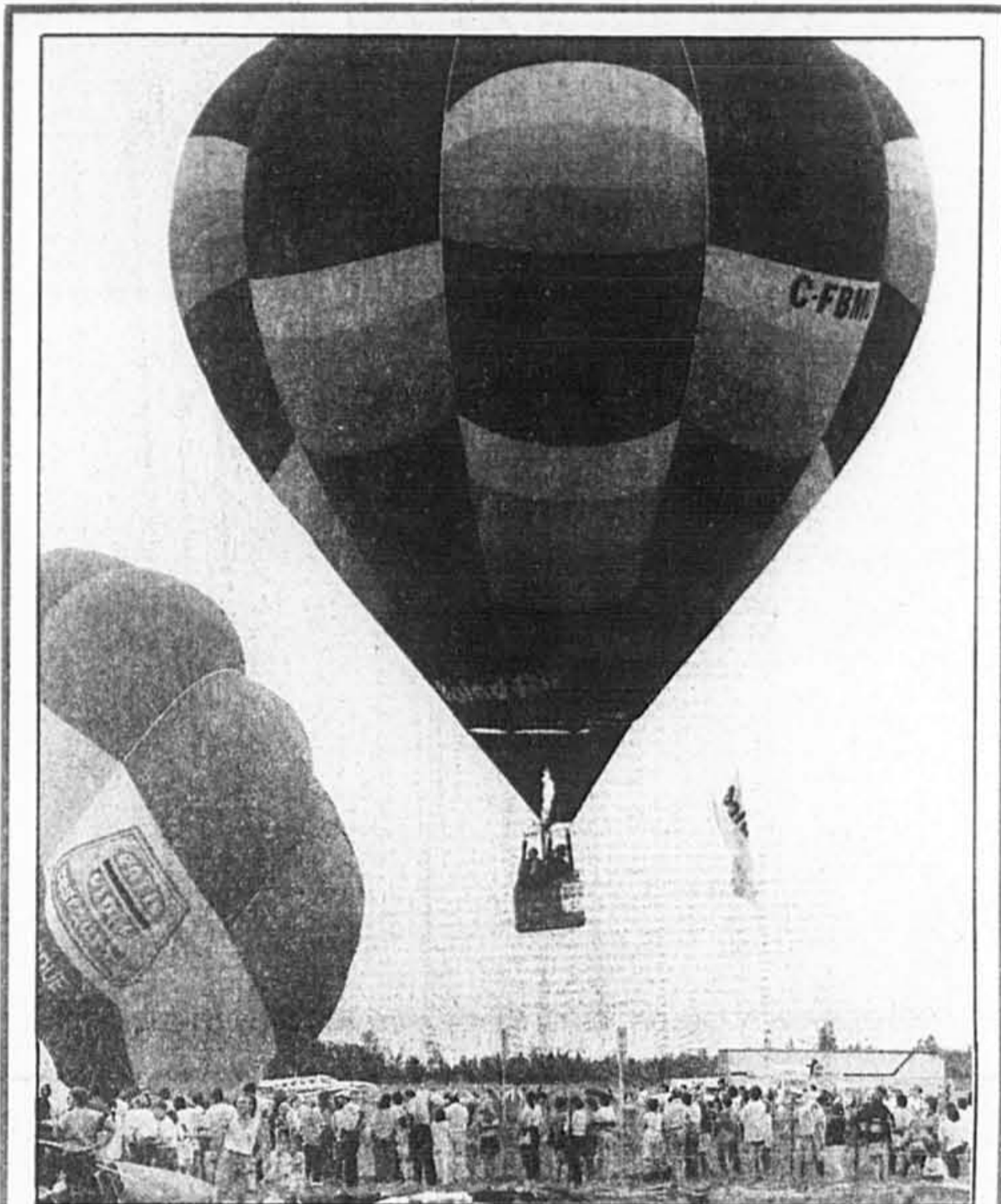
Environ 10 000 spectateurs ont assisté vers 18h30 hier aux premières ascensions de montgolfières à Saint-Jean-sur-Richelieu.