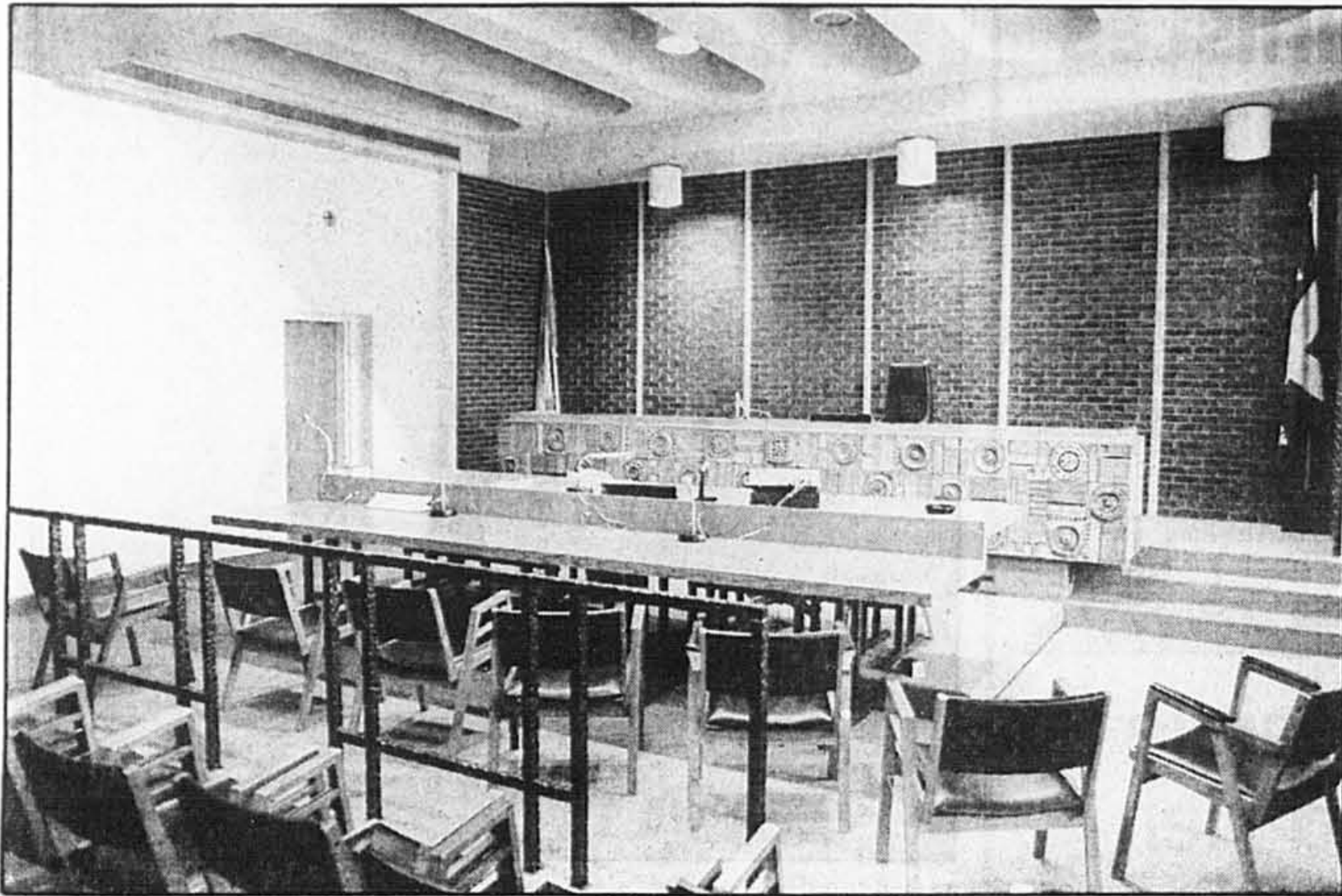
Chaque jour de jeunes contrevenants comparaissent devant le tribunal de la jeunesse