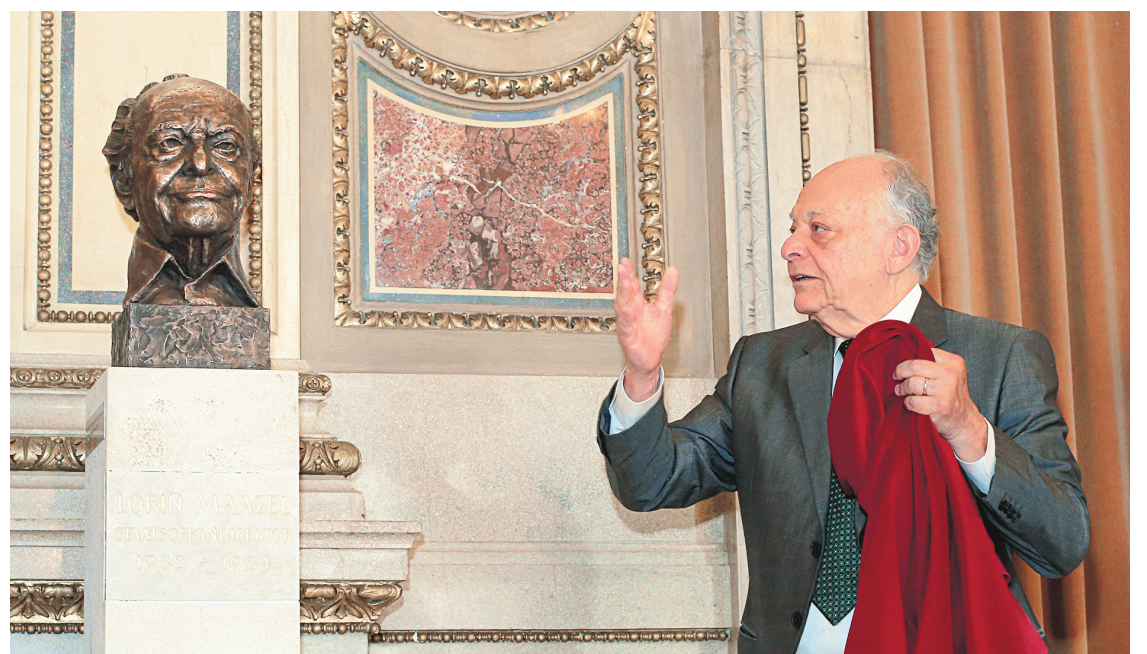
Le chef d'orchestre américain Lorin Maazel a vu son faciès immortalisé dans un buste de bronze le 25 septembre 2013 à l'Opéra national de Vienne, qu'il a dirigé par le passé.

Dès l'arrivée du CD, Maazel est sur tous les fronts et multiplie les disques avec le Philharmonique de Berlin pour DG (intégrale Rachmaninov, disques Richard Strauss et une grandiose Symphonie lyrique de Zemlinsky) et EMI (étrangement tous mauvais), ainsi qu'avec le Philharmonique de Vienne pour DG ( Valses de Johann Strauss, Symphonies de Dvorák) et