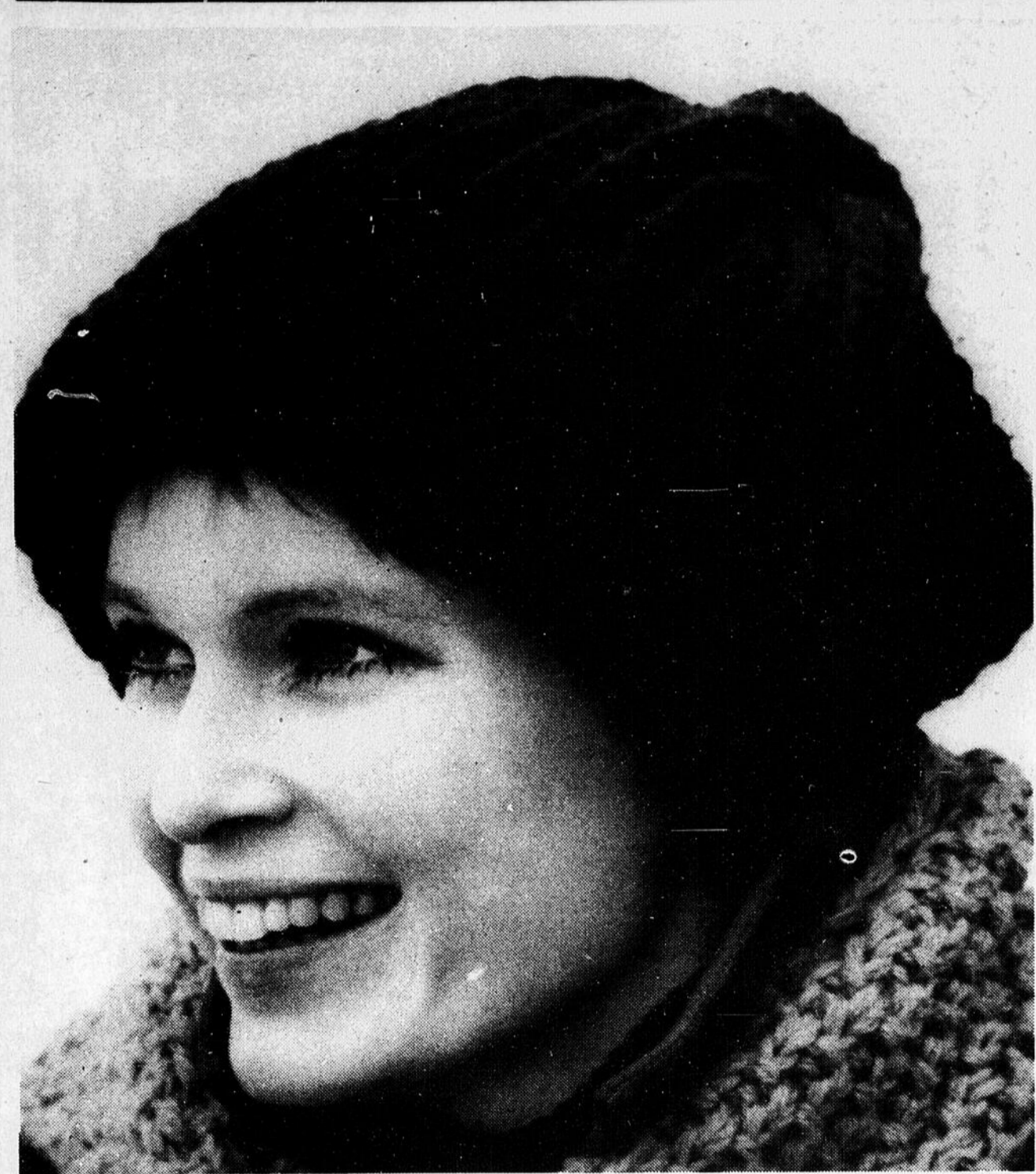
Mia Farrow dans une scène de "John and Mary" de Peter Yates.