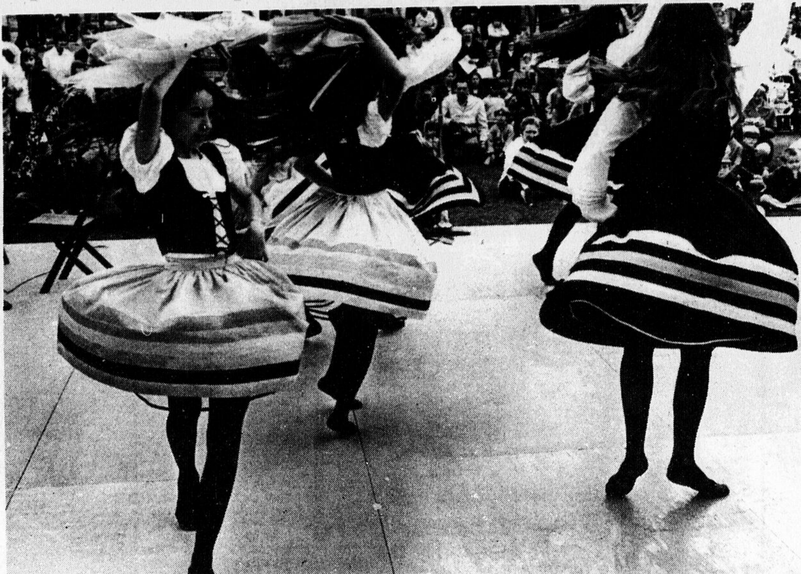
UN ART POPULAIRE — Les jupes volent et les cheveux se soulèvent, lorsque ce groupe folklorique italien danse, comme ici, lors d'un Festival à Winnipeg.

Winnipeg compte quelque 25 groupes folkloriques, composés d'Ukrainiens, de Juifs et d'Indiens. Des danseurs de tout âge en font partie. La plupart des groupes plus anciens donnent des spectacles.