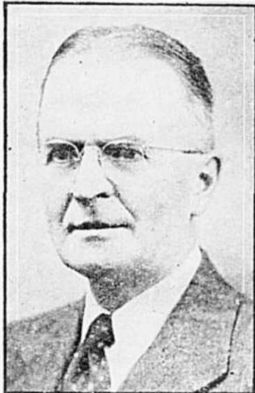
Mesdames, mesdemoiselles, mes chers amis,