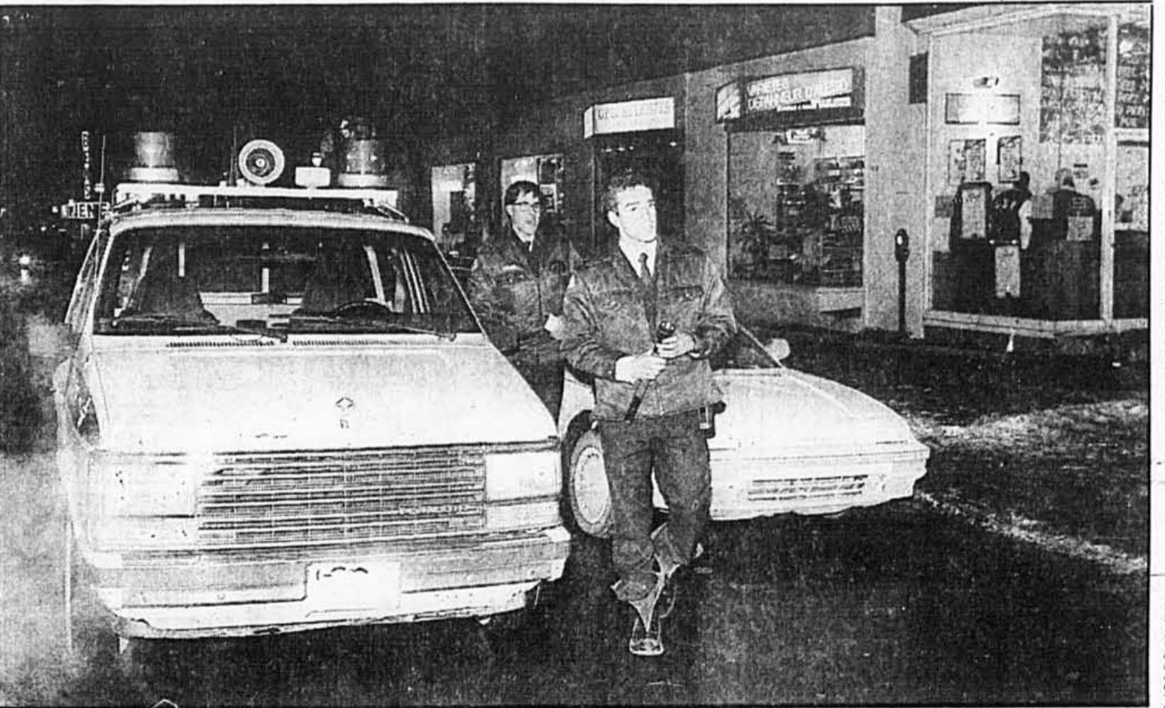
Des policiers du poste 25 accourent: encore une bagarre au centre-ville.