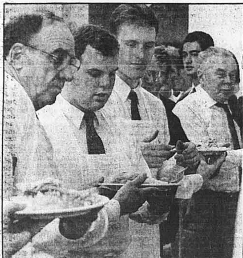
La Old Brewery Mission a accueilli environ 400 hommes, à qui 150 bénévoles ont servi la dinde traditionnelle et donné des petits cadeaux.

«On avait préparé de la nourriture pour 700 personnes. Bah, on n'aura pas à s'inquiéter pour savoir quoi manger cette semaine», a souri le révérend McCarthy.