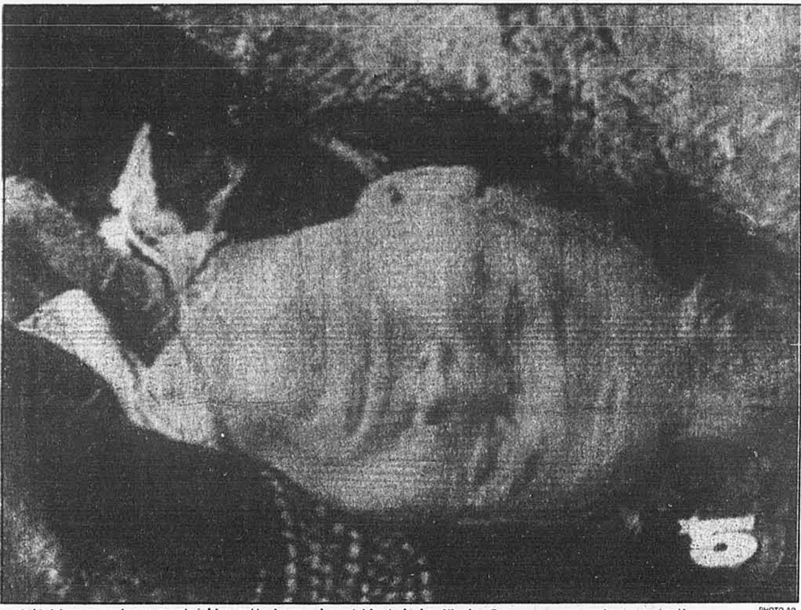
La télévision roumaine a montré hier cette image du président déchu, Nicolae Ceausescu, peu après son exécution.

d'après AFP, Reuter, AP, UPI et CP BUCAREST