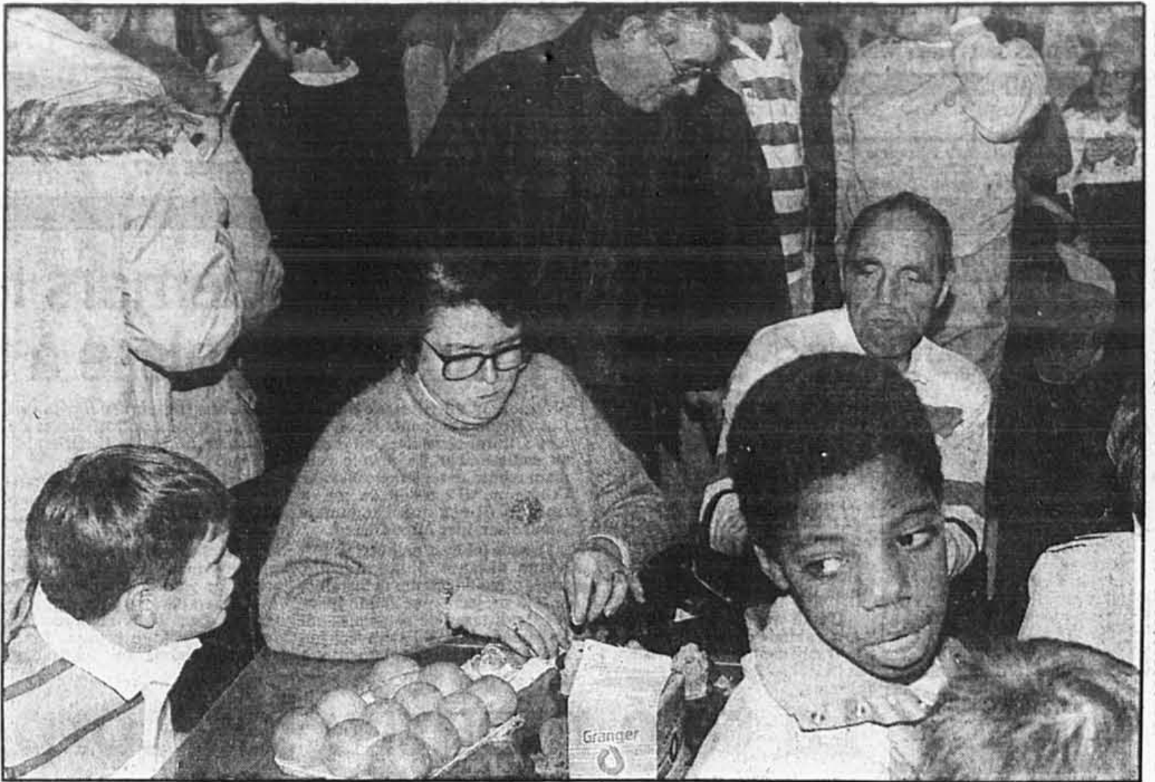
Les occupants des 200 voitures qui se sont tamponnées sur la route 35 ont été conduits par des motoneigistes à l'hôtel de ville de Saint-Luc. Ils ont pu poursuivre leur route en fin de soirée.