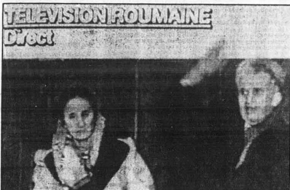
Cette image du président Nicolae Ceausescu et de sa femme Elena, diffusée hier par la télévision roumaine et captée par la télévision française à Paris, montre le couple lors de son procès, à Bucarest. Le «Conducator» et sa femme devaient être exécutés quelques instants après que le film eut été pris.

truire cette bande qui, avec l'aide de puissances étrangères, veut détruire le pays et a perpétré un coup d'État», a crié Ceausescu en agitant le bras et en pointant le doigt.