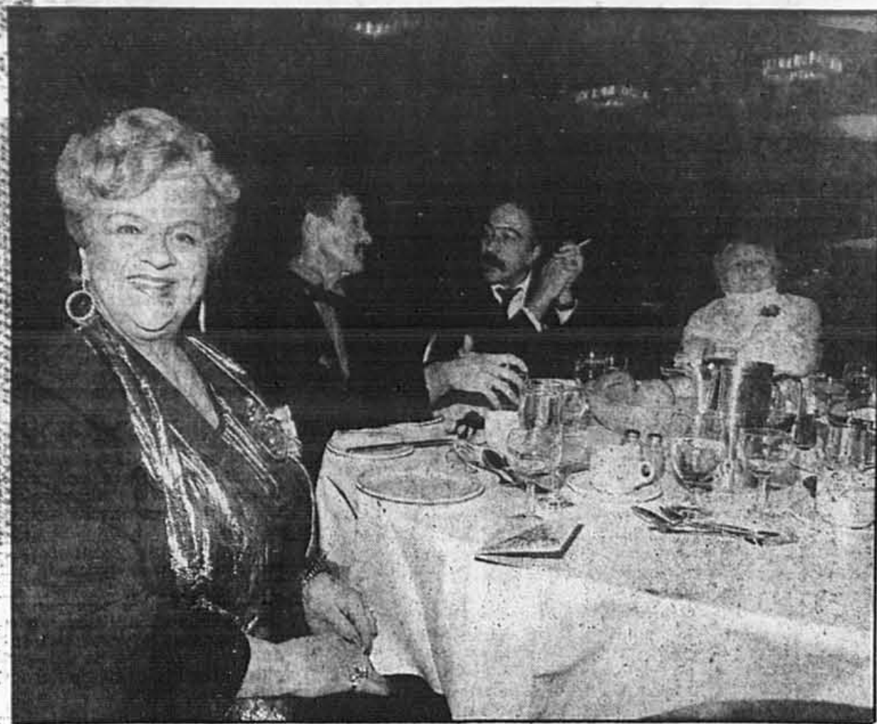
La chanteuse et grande vedette des années 40, Mme Alys Roby a donné un petit récital au déjeuner de Noël des Petits frères des pauvres. Un beau cadeau pour les 425 vieux convives.