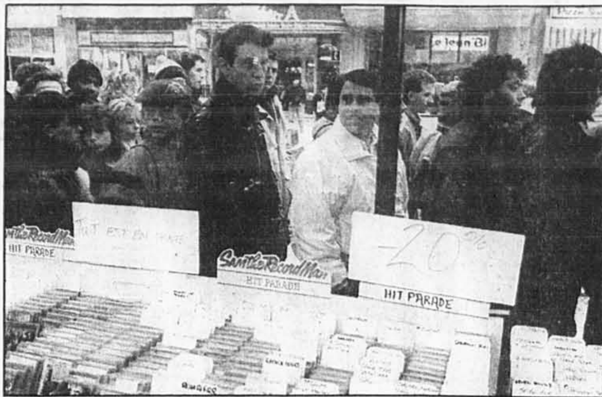
Des centaines de clients formaient un sillon bien compact devant chez Sam, rue Sainte-Catherine.

Alors que, très souvent, les clients du cinéma Impérial, rue Bleury, font la queue jusque devant le célèbre disquaire de la rue Sainte-Catherine, chaque 26 décembre, douce revanche, les mé-