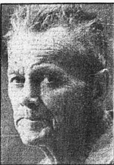
Doug Harvey (1924-1989)