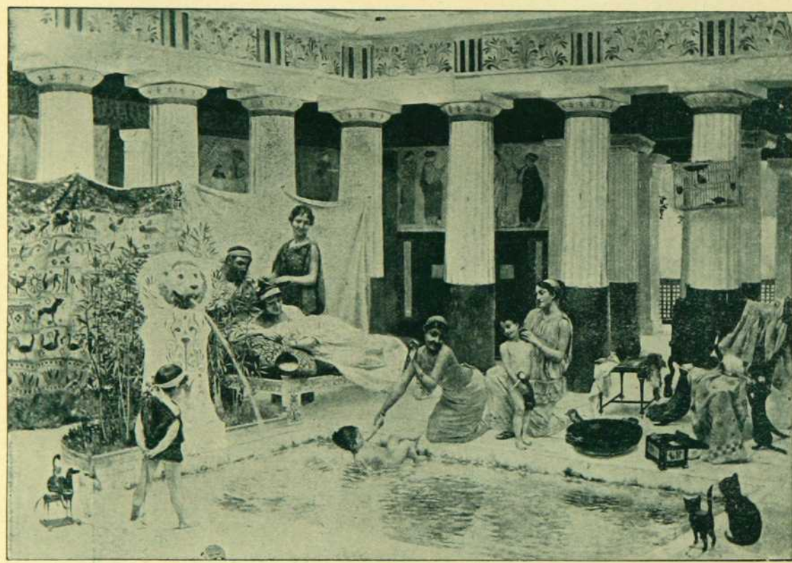
“ LE GYNECEE,” par G. ROCHEGROSSE.

CE TABLEAU qui a été exposé au Salon des Champs Elysées, à Paris, fait partie des collections de LA SOCIÉTÉ DES ARTS DU CANADA . . . . .