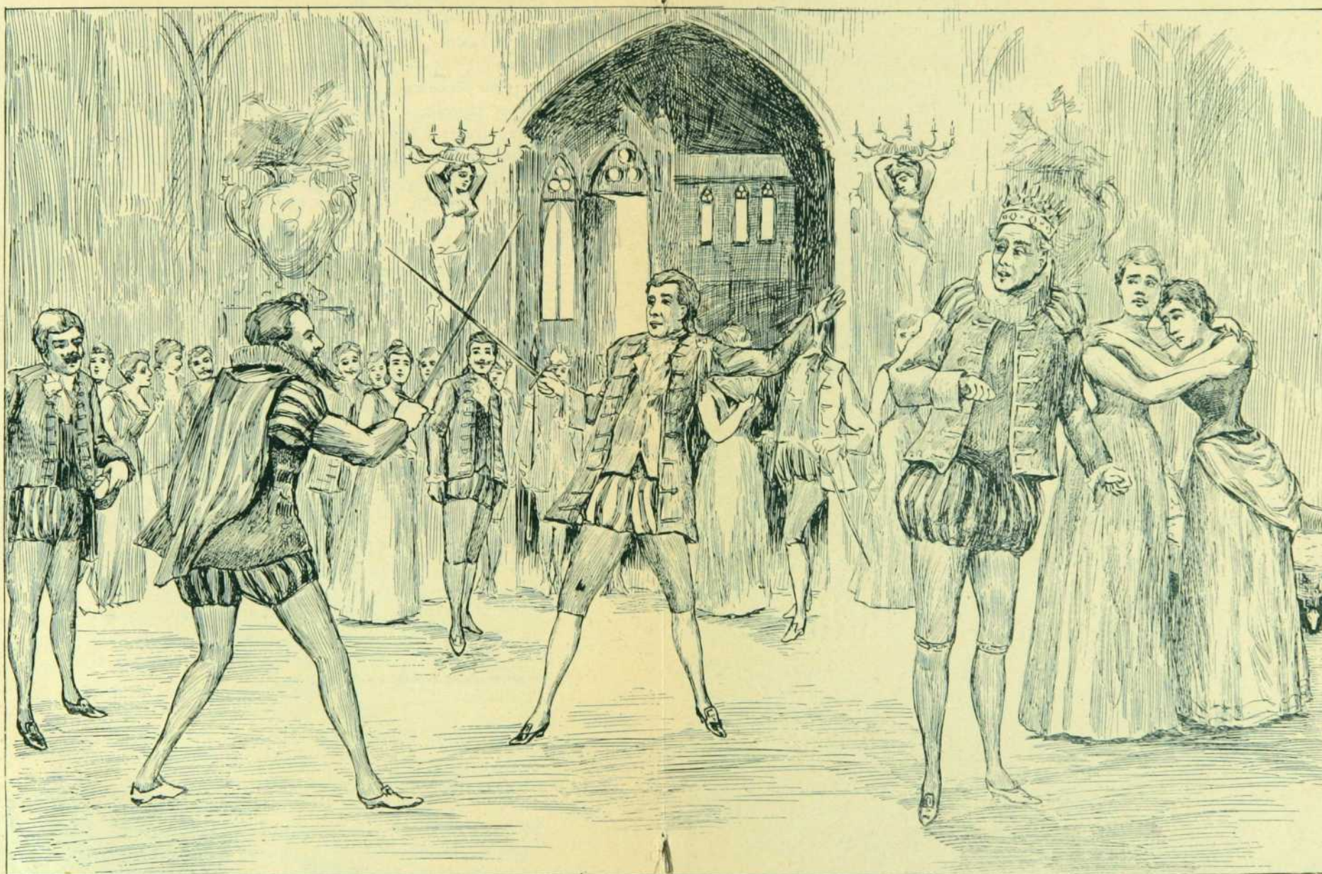
BARBE BLEUE. — Duel de Barbe Bleue et du prince Saphir.

A son arrivée, il rencontre son vieux camarade Popalani, alchimiste du sire de Barbe Bleue. Popalani lui raconte que son maître est veuf de sa cinquième femme et est pris de la fantaisie de couronner une rosière ; il ne sait comment s'y prendre pour en trouver une. Oscar lui indique un bon moyen ; il faut faire rassembler toutes les jeunes filles du pays et les faire tirer au sort ; comme cela, s'il n'y a pas de rosière parmi elles, il en trouvera une tout de même, et s'il y en a plusieurs, aucune ne pourra l'accuser de partialité. Il lui raconte à son tour la mission dont il est chargé, et ajoute que si le hasard ne l'aide pas à retrouver Hermia, il emploiera le tirage au sort pour trouver une