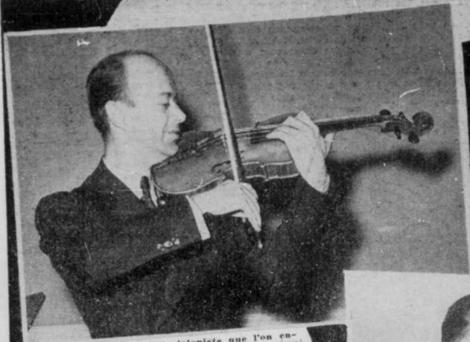
★ LUCIEN MARTIN violoniste que l'on entend tous les matins avec "Les Joyeux Troubadours" à Radio-Canada.