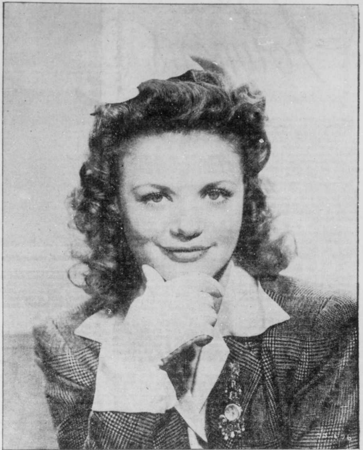
SIMONE SIMON, la grande "tiste du théâtre et du cinéma français et américain qui vient à Montréal pour jouer au théâtre Lux, à CKAC et à La Comédie de Montréal, où elle interprétera le rôle de Pernelle de "Les Jours Heureux", au Monument National, au Palais Montcalm, à Québec, et au théâtre Capitol, des Trois-Rivières.