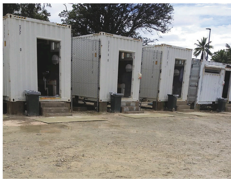
Une photo du camp de l'île de Manus prise en 2016 et obtenue par la Coalition d'action pour les réfugiés le 14 juin dernier.

Mais la résistance s'organise : nous manifestons tous les jours à 14 h. Notre protestation est complètement paci-