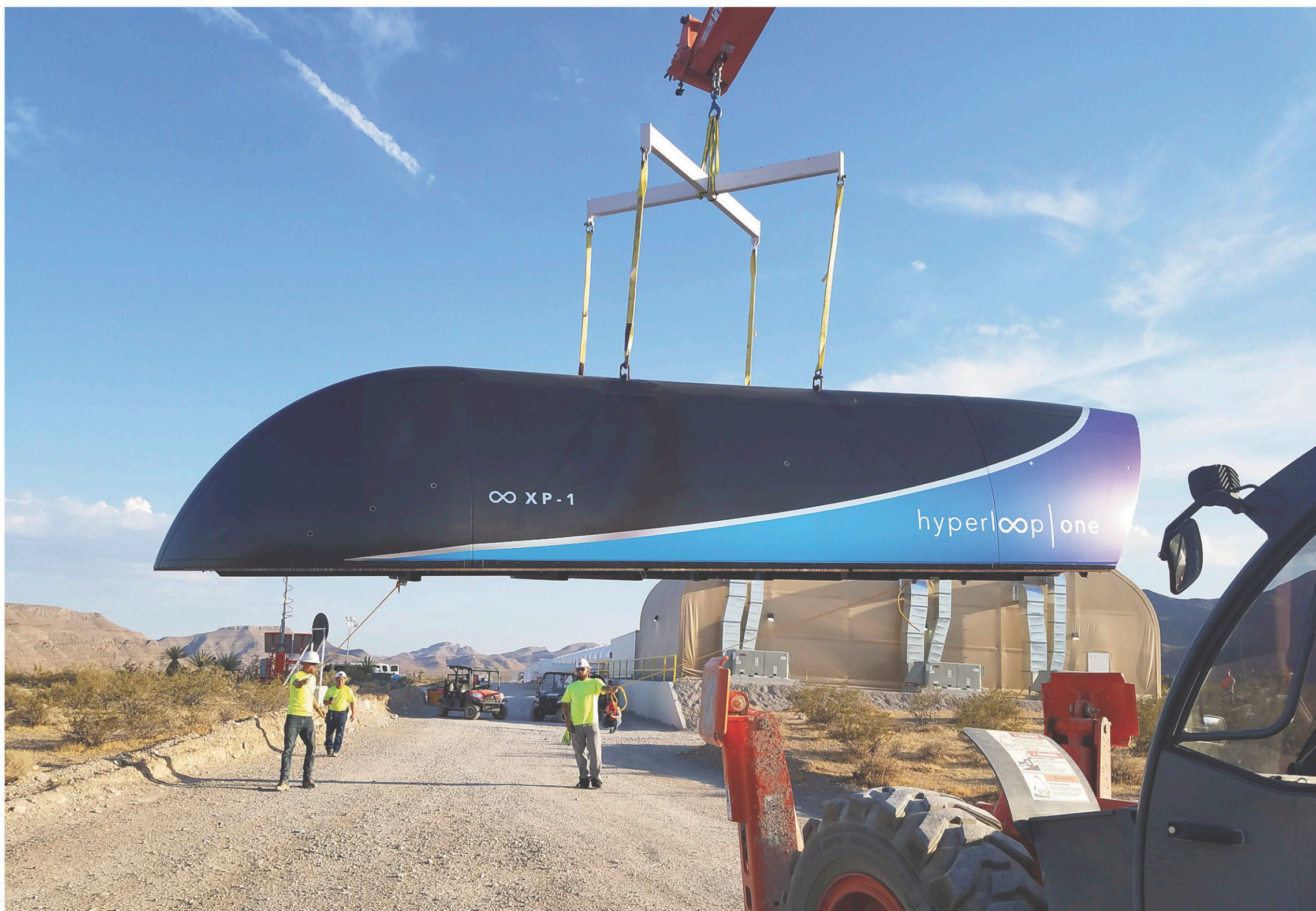
Testé pour la deuxième fois fin juillet en plein désert du Nevada, aux États-Unis, le train à très grande vitesse Hyperloop pourrait être mis en service dès 2021, selon l'entreprise qui le développe, Hyperloop One. Cette dernière a d'ailleurs dévoilé cette photo, sur laquelle on peut apercevoir ce qui serait le prototype de la capsule de passagers.