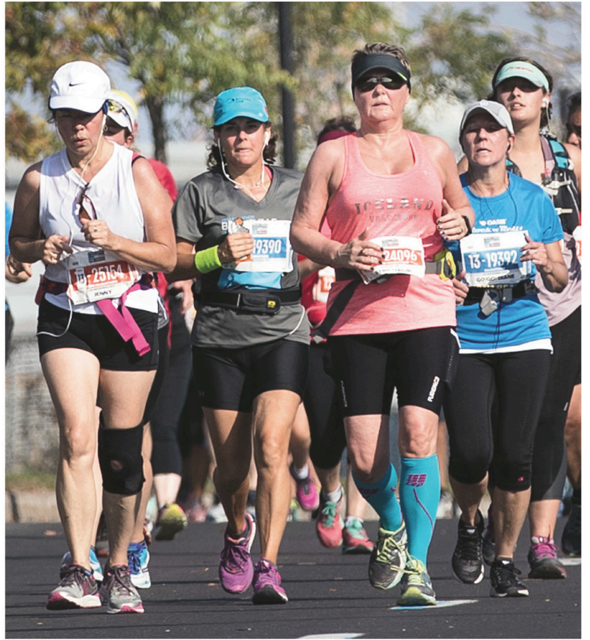
Les coureurs du demi-marathon ont dû affronter une chaleur quelque peu inhabituelle pour la saison, dimanche, lors de l'épreuve qui a obligé le déploiement d'un important dispositif médical.