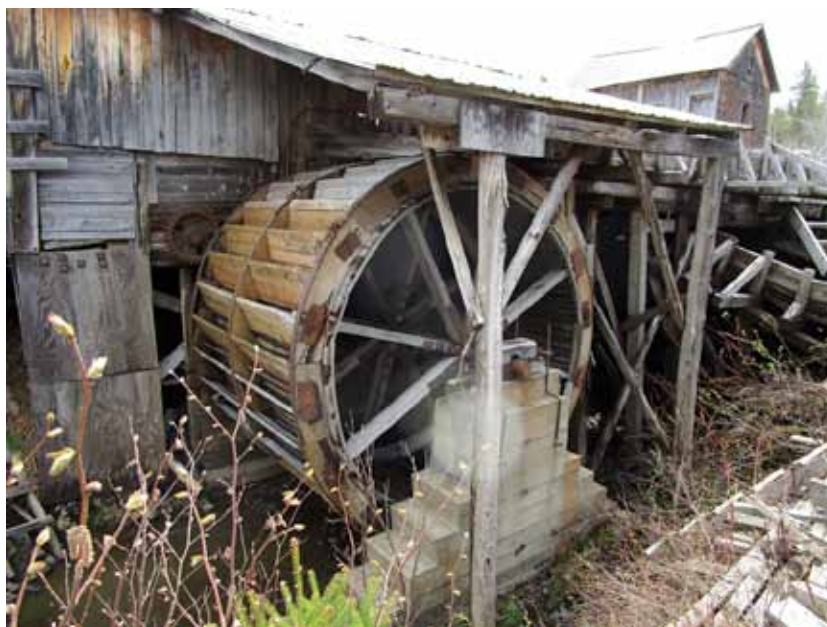
La roue à godets d'une petite scierie de Saint-Pascal (Roger Madore).

Au temps de la colonisation, les chutes et les rapides des rivières ont fait tourner plusieurs roues à eau. Dans chaque village du Bas-Saint-Laurent, les habitants harnachaient des cours d'eau avec un petit barrage et créaient des étangs de retenue afin de mettre en branle les mécanismes de moulins à scie. Au 20 e siècle, les roues à godets ont été remplacées par des turbines ou des engins à vapeur, puis par des moteurs à essence et des moteurs électriques. Dans ces moulins, les scieurs ont abandonné la scie verticale (à châsse ) pour la scie circulaire et plus récemment pour la scie à ruban industrielle. Aujourd'hui, même si les techniques de fonctionnement pour la production de bois de sciage ont changé, le savoir-faire se perpétue.