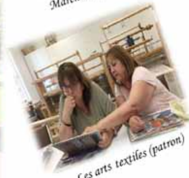
Les arts textiles (patron)

Vente estivale Date : du 24 juin au 1 aout