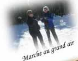
Marche au grand air