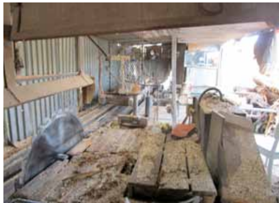
La scie ronde et le charriot muni de griffes de métal pour débiter le bois de la scierie à Lamy. Photo : Georges Pelletier (2021)