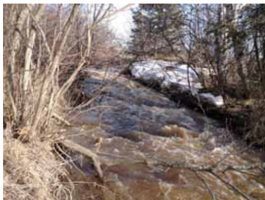
La chute de l'ancien moulin à scie sur la petite rivière du Loup, près de la maison ancestrale des Dumont dans le Petit rang 2. Photo : Georges Pelletier (2019)

Sur le deuxième rang (Petit Rang 2), la petite rivière du Loup, qui traverse un coteau rocheux, faisait tourner la roue et le mécanisme d'une scie à châsse non loin de la maison ancestrale de Michel-Évangéliste Dumont. En 1825, un menuisier de Cacouna, François Bérubé, avait obtenu le droit d'ériger un barrage et un moulin sur cet emplacement; le premier curé de la paroisse de Kakouna , Jean-Marie Madran, l'avait aidé financièrement afin de lui permettre de construire sa scierie avec tous ses mouvements, tournans et travaillans 5 .