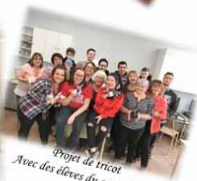
Projet de tricot Avec des élèves du secondaire

Cercle de Fermières Cacouna 420, rue du Couvent Cacouna G0L 1G0 418-867-1781 #229