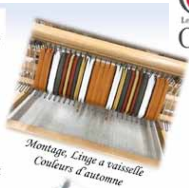
Montage, Linge à vaisselle Couleurs d'automne

Vous ressentez l'appel d'apprendre une nouvelle technique : tricot, tissage, couture, broderie ou autres, nous avons des ressources pour vous.