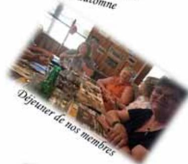
Dejeuner de nos membres