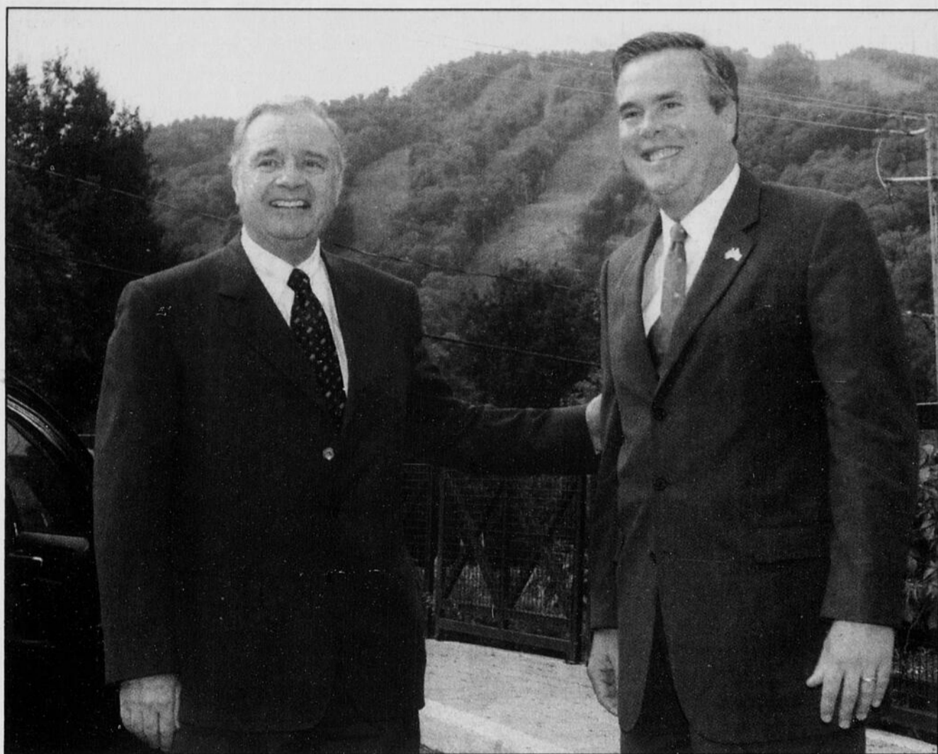
En visite au Québec, le gouverneur de la Floride Jeb Bush (à droite) s'est arrêté à Bromont hier où le premier ministre du Canada Paul Martin l'a accueilli.

À cette occasion, M. Bush avait alors laissé entendre qu'il souhaitait trouver une autre façon de donner accès à des