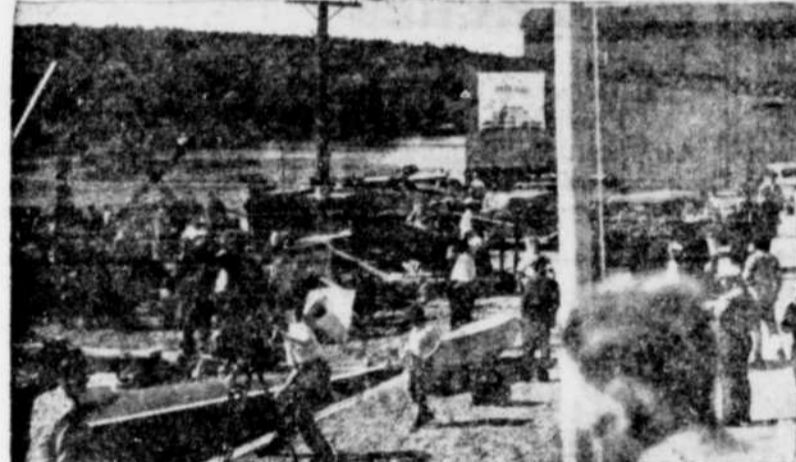
Le quai du départ est d'une animation inaccoutumée pendant les régates.