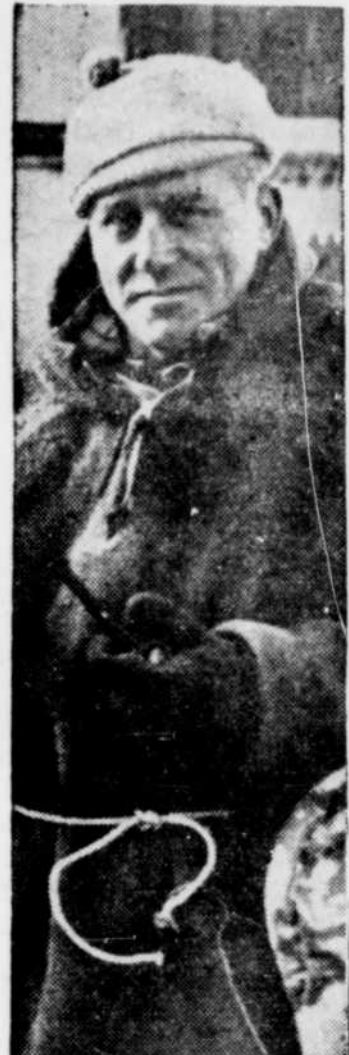
Herbert HOLLICK-KENYON, célèbre aviateur canadien, qui s'est joint à ceux qui recherchent les six aviateurs russes perdus quelque part dans l'Arctique au cours d'une envolée de Moscou à San-Francisco. M. Kenyon a beaucoup d'expérience dans les vols en régions arctiques et antarctiques.

Le violent bombardement des canons chinois contre les positions riveraines des marins japonais met le feu au district de Hong-Kéou, et la panique s'empare de la population.