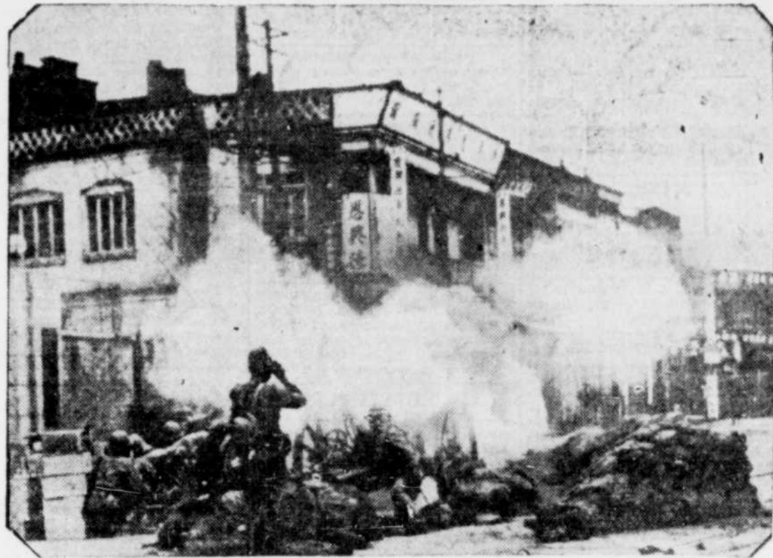
Voici une des premières photographies qui vient d'arriver au Canada représentant les troupes en action livrant combat dans une des rues principales de Tientsin.

11 divisions entières de l'armée chinoise prennent part à l'assaut contre l'invasisseur japonais.