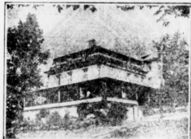
HOTEL PLEASANT VIEW