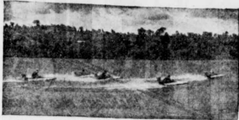
Voici une vue prise à North Hatley, au cours des régates de l'an dernier. La course semble chaudement disputée.