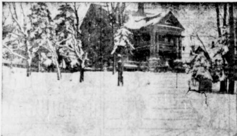
"CONNAUGHT INN" — OUVERT ÉTÉ ET HIVER.

A l'occasion des régates de North Hatley