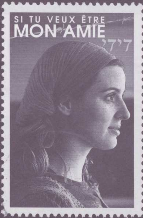
ILLUSTRATION Vincent Champoux