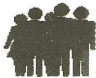
Table d'action contre l'appauvrissement de l'Estrie