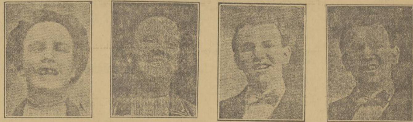
Remarquez ces jeunes personnes avec leurs mauvaises dents (à gauche) et remarquez leurs figures épanouies après qu'elles furent traitées, soignées, sauvées par le dentiste.

Trop de monde malheureusement ne connaît pas les bienfaits d'une parfaite dentition. L'HYGIENE DENTAIRE est de nécessité PRIMORDIALE. Les mauvaises dents sont la cause d'une foule de maux. On a découvert dans les mauvaises dents les microbes de la fièvre typhoïde, de la tuberculose et de la PARALYSIE INFANTILE. TRENTE-DEUX BONNES DENTS, CE SONT TRENTE-DEUX MEDECINS QUI VOUS SOIGNENT. Si vous voulez avoir une BONNE DIGESTION, ayez de BONNES DENTS. L'ART DENTAIRE a fait des PROGRES CONSIDERABLES depuis vingt ans. AUJOURD'HUI, on pose LES DENTS SANS PALAIS. AUJOURD'HUI, on extrait les dents sans douleurs. AUJOURD'HUI, on pose des dentiers qui remplacent à s'y tromper les dents naturelles. AUJOURD'HUI, il n'est plus nécessaire de se faire extraire les dents. ON LES TRAITTE, on les soigne et on les guérit et cela SANS DOULEUR.