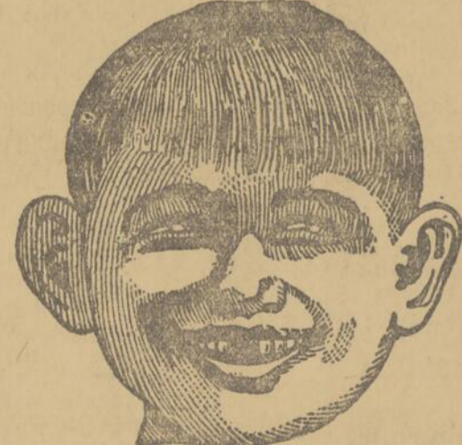
Sapristi, les dentistes de l'Institut Dentaire ne m'ont pas fait mal du tout... du tout.

Hommes, Femmes et Enfants Consultez nos Dentistes experts