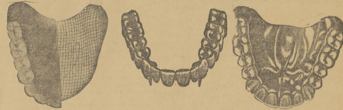
Dentiers inusables, incassables qui font à la perfection, qui s'adaptent à la perfection et avec lesquels vous pouvez manger et parler comme avec de vraies dents.