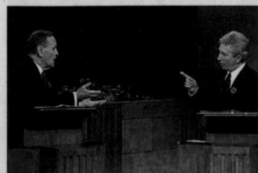
Jean Chrétien et Gilles Duceppe, lors du débat des chefs de 2000.