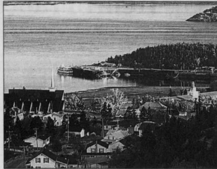
SOURCE FESTIVAL DE LA CHANSON DE TADOUSSAC Une ombre plane sur l'avenir du Festival de la chanson de Tadoussac, dont le financement demeure menacé.

Les organisateurs ont appris une semaine et demie avant l'ouverture de la 21 e édition que leur subvention de 50 000 $ du ministère du Tourisme serait réduite à 10 000 $! La mauvaise nouvelle est tombée au moment où tous les contrats étaient signés, les salles et les équipements techniques loués et la plupart des