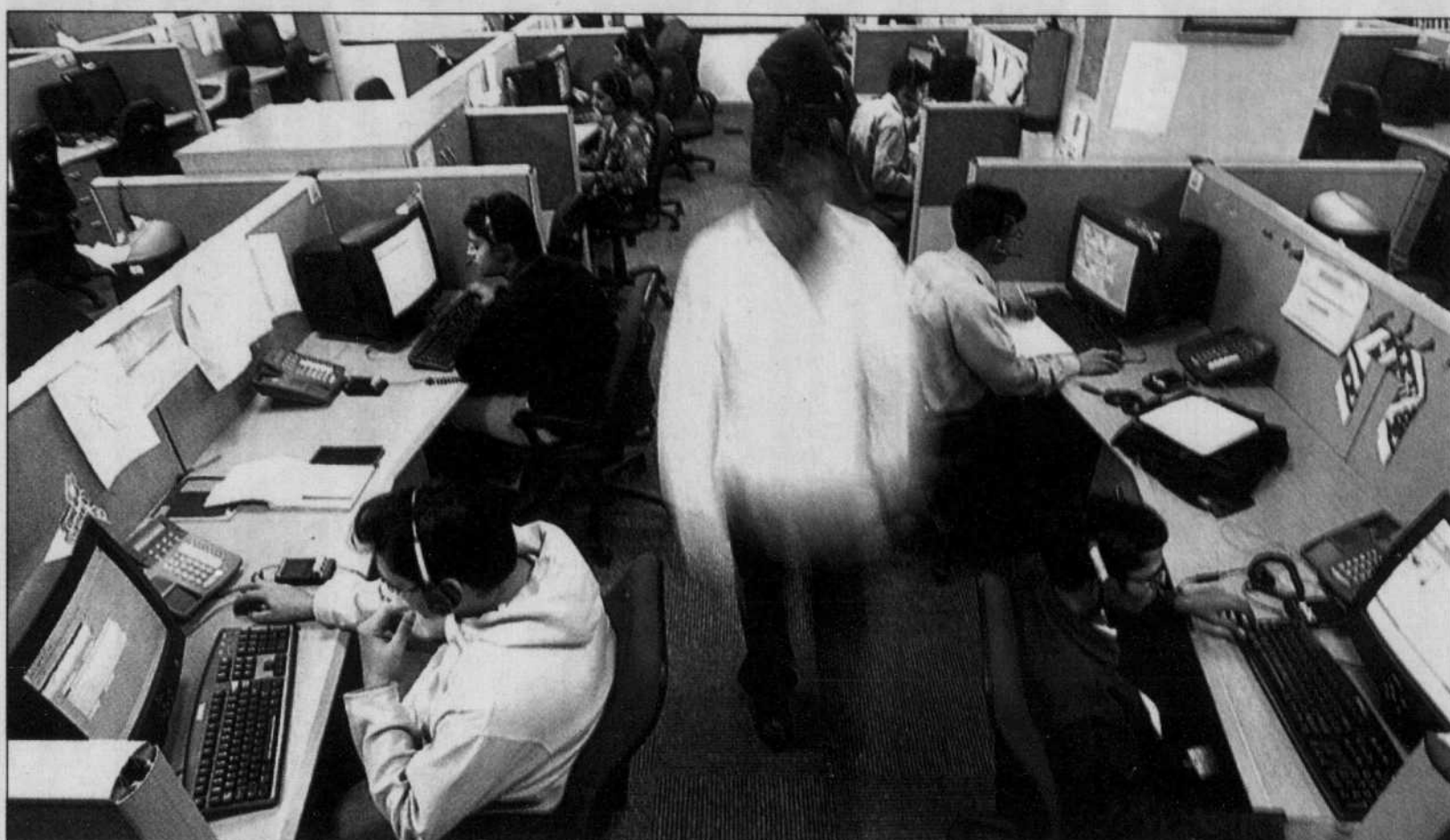
KAMAL KISHORE REUTERS

L'auteur est conseiller en placement et président d'Avantages Services Financiers, une société indépendante spécialisée dans le courtage de fonds de gestion de placement et de gestion privée.