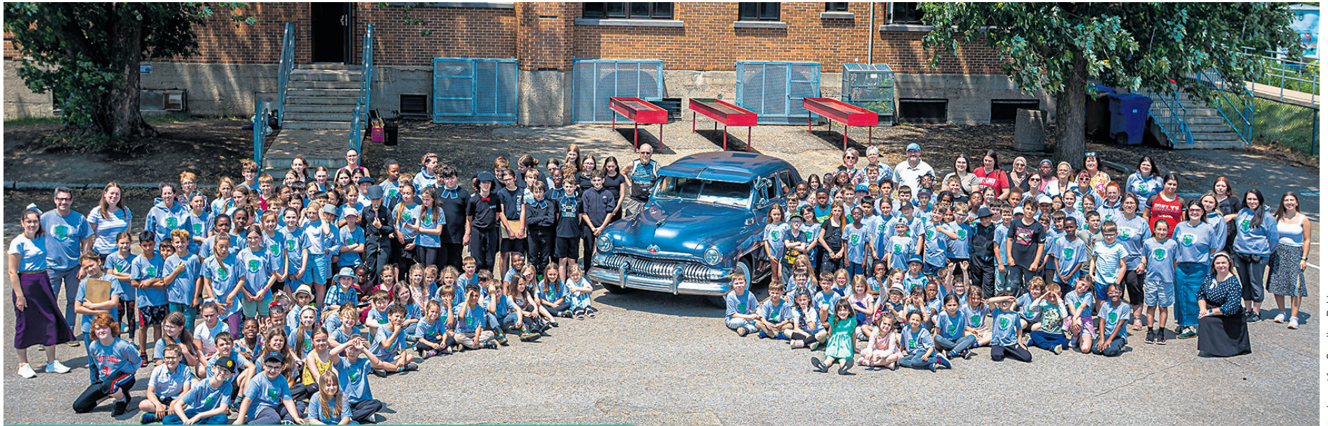
Tous les élèves et membres du personnel se sont rassemblés pour croquer le moment.