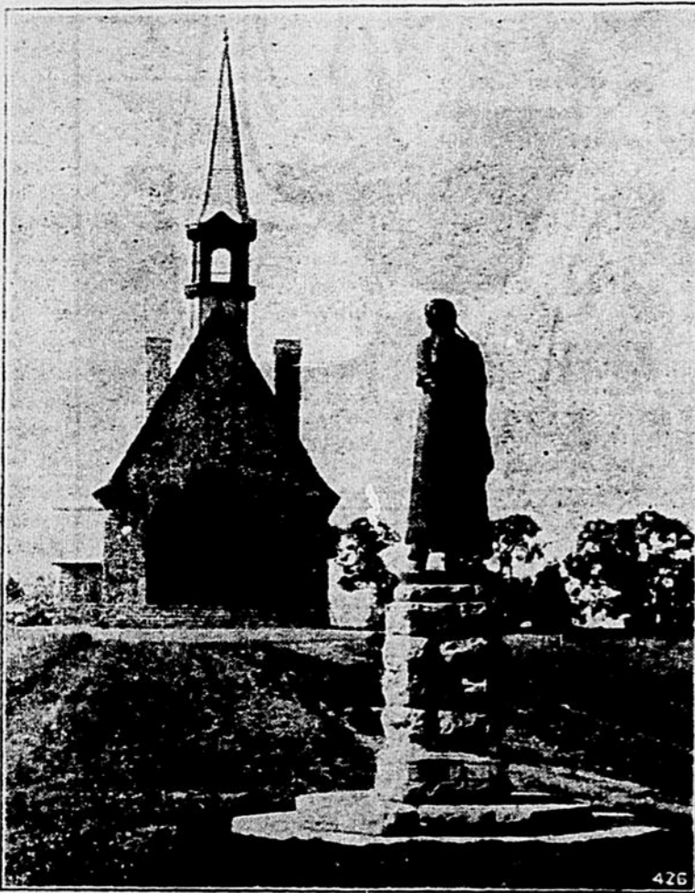
Chapelle commémorative et statue d'Évangéline à Grand-Pré

La vogue du tourisme s'accroît de façon remarquable au pays d'Évangéline, si l'on en juge par le fait qu'au cours de l'été de 1929, 15,787 touristes sont allés visiter le monument et la chapelle commémorative érigés à Grand-Pré, à la mémoire de l'héroïne de Longfellow, comparativement à 12,066 visiteurs en 1928. Le parc historique où se dresse le monument, œuvre du sculpteur canadien-français Hébert, a été aménagé sous les soins du chemin de fer Dominion Atlantique, filiale du Pacifique Canadien, qui en était le propriétaire avant de l'offrir à la société de l'Assomption. Le puits d'Évangéline ou, suivant la tradition, Évangéline allait puiser de l'eau et rencontrer son fiancé Gabriel, est resté dans son état primitif, et la Société de l'Assomption, organisation nationale des Acadiens, a fait construire, il y a quelques années, la petite chapelle que l'on voit aujourd'hui au fond du parc. Cet endroit, abandonné et désolé autrefois, a maintenant été transformé en l'un des lieux les plus pittoresques de la Nouvelle-Écosse, et les touristes y défilent par milliers pendant la belle saison. Au