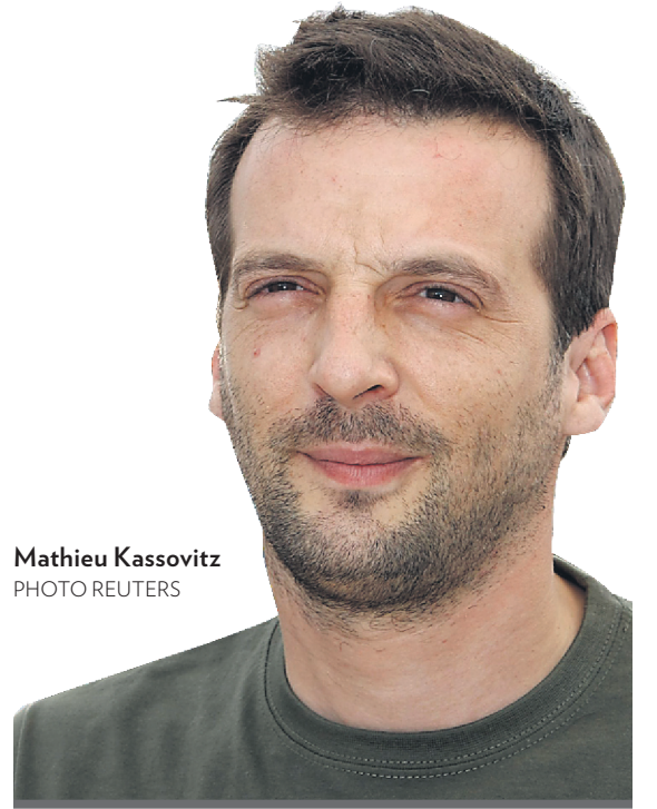
Mathieu Kassovitz