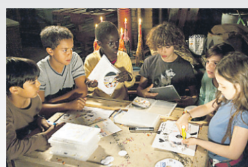
Les mains en l'air

L'action et l'humour bon enfant d' On Stranger Tides rappellent le vent qui soufflait sur The Curse of the Black Pearl qui a fait entrer Jack Sparrow (ineffable Johnny Depp) dans l'imaginaire populaire. Cependant, le scénario affiche plusieurs failles. Quant au 3D, il sort bien à l'écran. (S.S.)