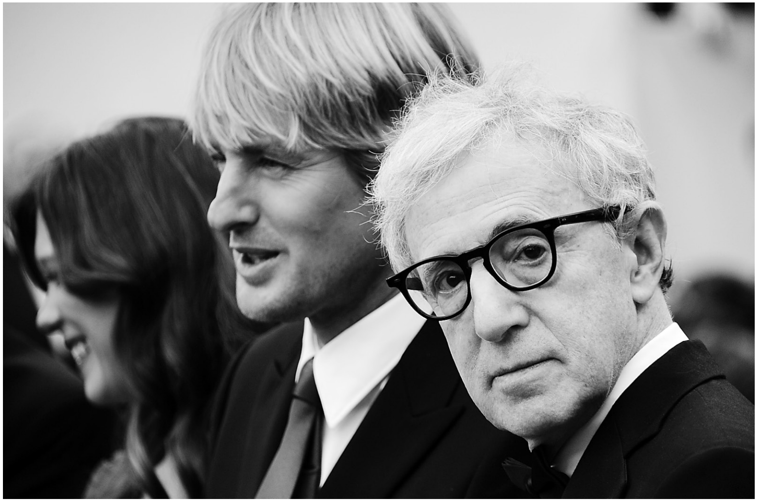
Owen Wilson et Woody Allen sur le tapis rouge du Festival de Cannes pour la présentation de Midnight in Paris .

«Au départ, je n'avais que le désir de concevoir un film romantique, reconnaît le réalisateur de Manhattan . Et j'avais ce titre qui me trotait dans la tête: Midnight in Paris . Rien d'autre. Je n'arrivais pas à trouver ce qui pouvait bien survenir à cette heure-là dans la capitale française. Puis est venue l'idée de cette voiture qui emmènerait ce personnage vers une fête. Et je me suis dit que ce serait bien si Gil pouvait rencontrer là des gens qu'il idolâtre. Progressivement, l'idée de transgresser les époques s'est installée. Des artistes mythiques qui, bien entendu,