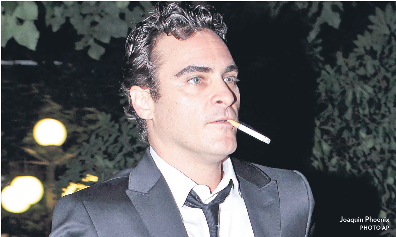
Joaquin Phoenix