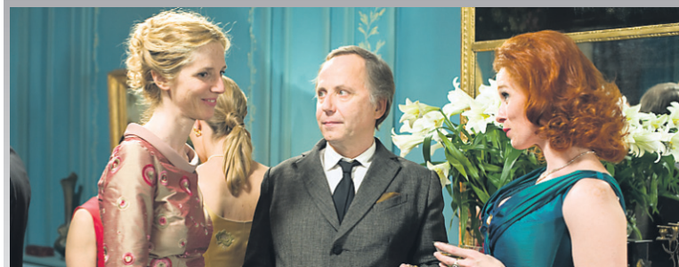
Les femmes du 6 e étage