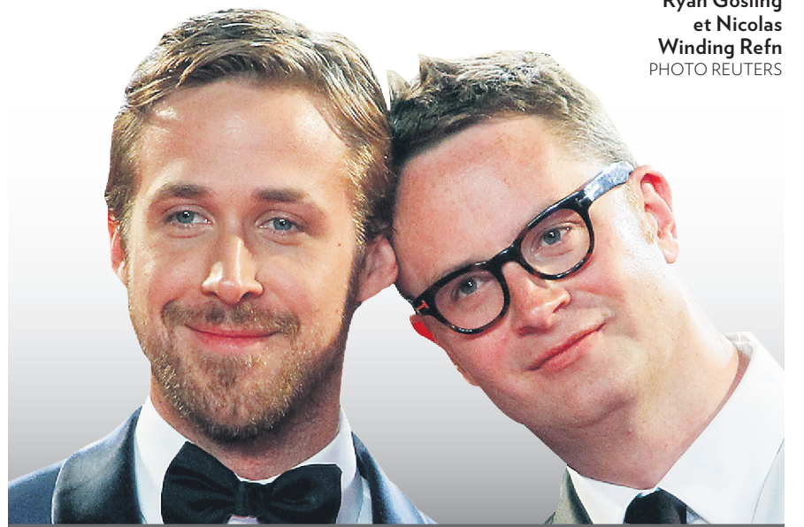
Ryan Gosling et Nicolas Winding Refn