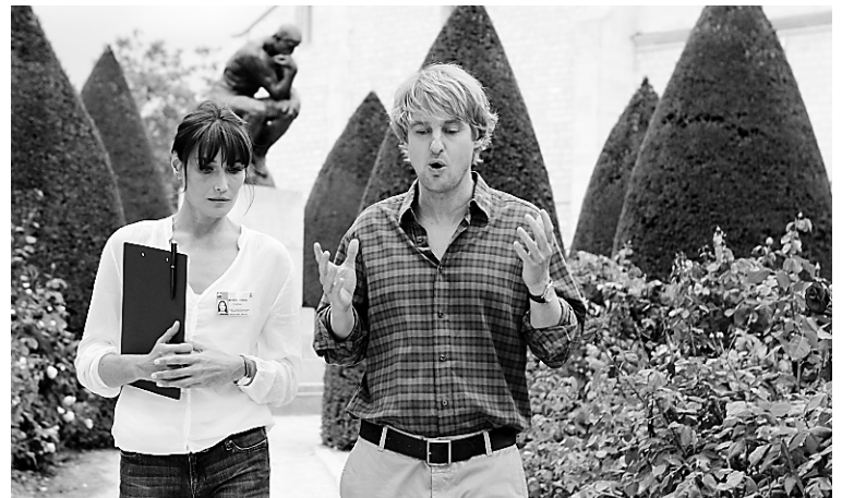
Carla Bruni-Sarkozy et Owen Wilson.

«Quand j'ai commencé à réaliser des films, c'était uniquement pour rencontrer des filles! dit-il. Je savais que cette profession-là te permettait de côtoyer de belles actrices et de devenir populaire auprès d'elles. Ce n'était peut-être pas la seule raison m'ayant poussé à me