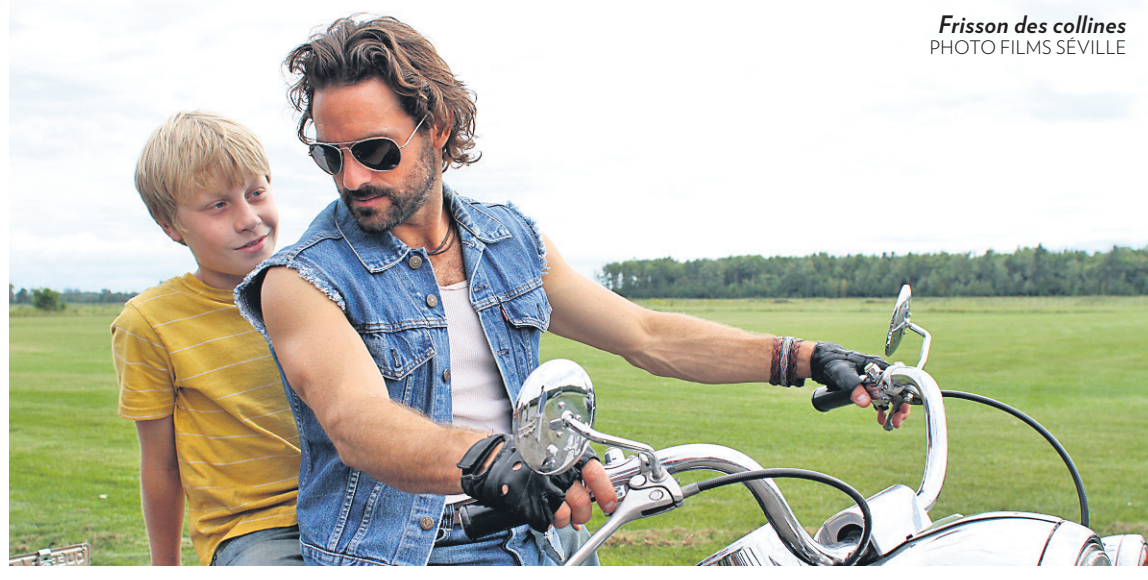
Frisson des collines PHOTO FILMS SEVILLE

Recettes brutes (avec taxes), compilées en dollars canadiens ($CAN) Toute reproduction partielle ou totale est interdite à moins d'une autorisation spéciale. © 2011 Cineac inc.