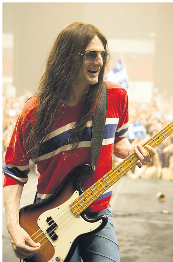
Scènes du film Gerry