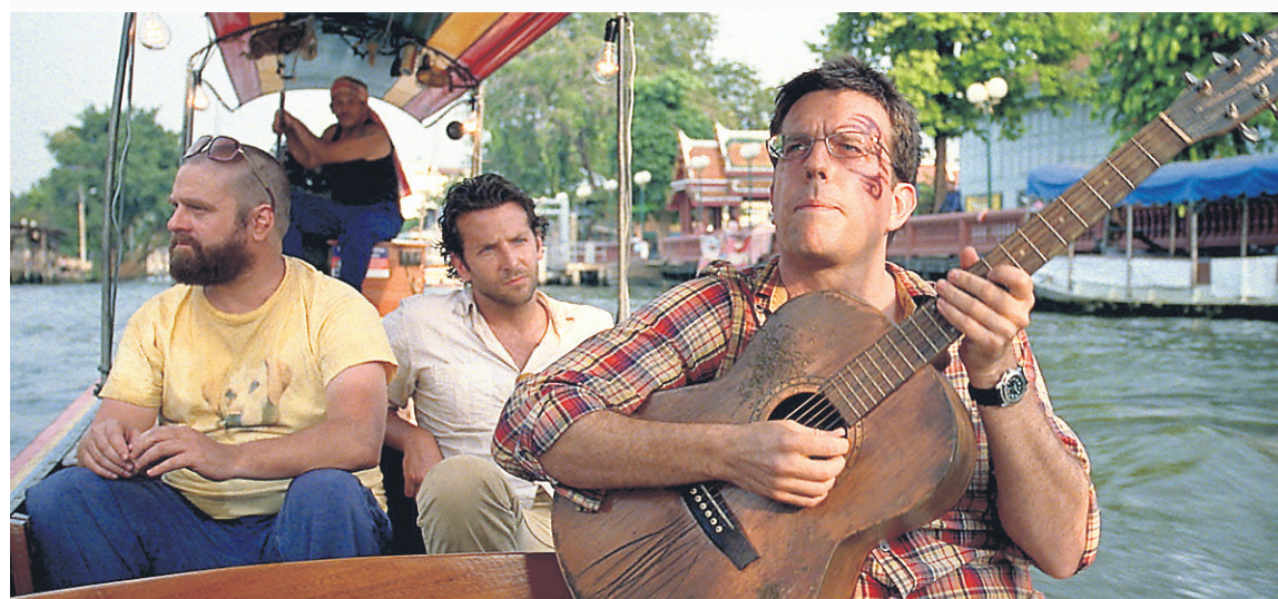
The Hangover Part II