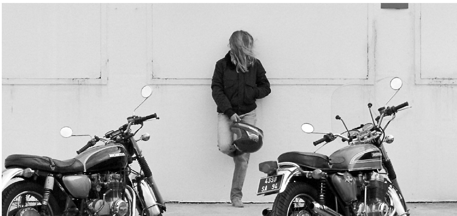
Belle épine , de Rebecca Zlotowski, trace le parcours d'une adolescente qui tente de s'intégrer au monde des courses de grosses cylindrées et de motos.

rencontrée avant de lui attribuer le rôle, cette jeune fille, livrée à elle-même, tente de s'intégrer dans un monde particulier. Grâce à une nouvelle amie, Prudence a en effet découvert un circuit «sauvage» où des jeunes participent à des courses au volant de grosses cylindrées et de motos rugissantes.