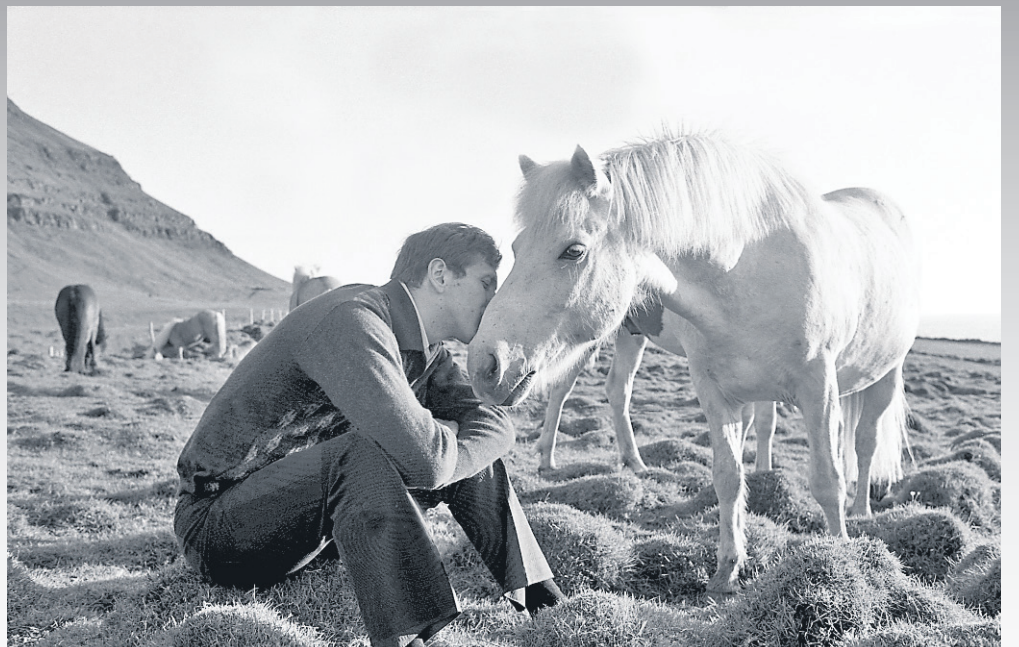
Bobby Fisher Against the World