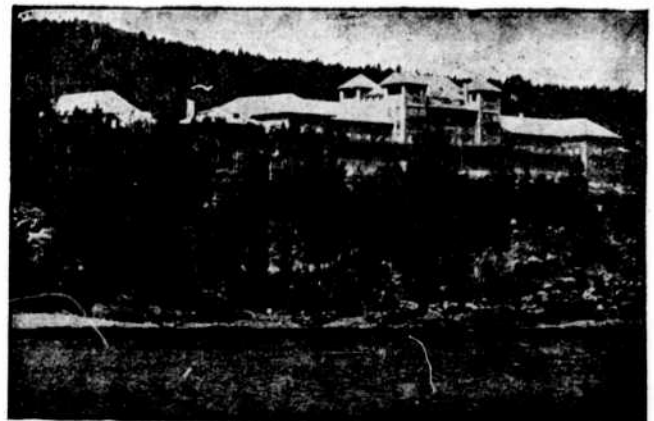
MANOIR RICHELIEU, MALBAIE