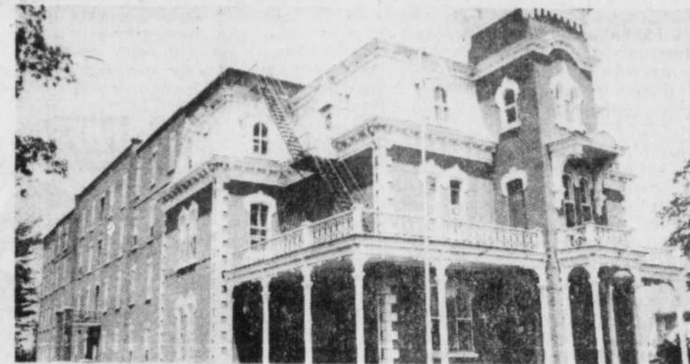
L'hôpital Sacre-Coeur de Plessisville passe graduellement à sa vocation de CLSC. Il est dans les plans du ministère (depuis 1972) d'ériger une nouvelle construction, plus fonctionnelle.

Le CLSC se veut le plus décentralisé possible, d'après les responsables. Déjà, une tournée dans les neuf municipalités a permis de le faire connaître. Des groupes consultatifs seront formés dans chaque paroisse, pour orienter l'action du CLSC basé à Plessisville. On verra peut-être un CLSC itinérant.