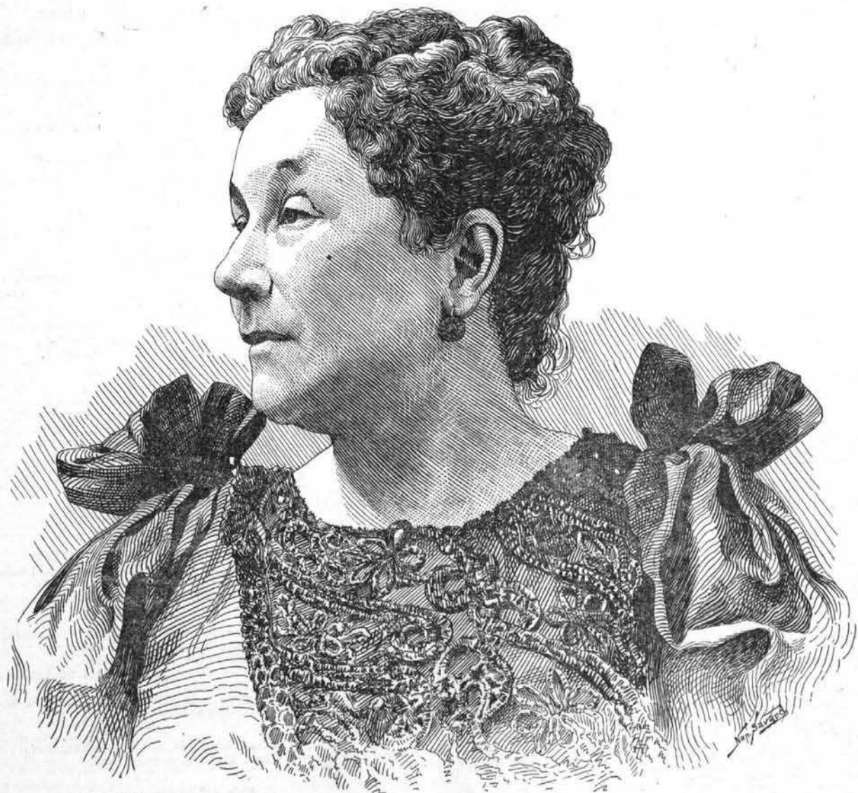
Dessin de N. SAVARD, d'après une photographie de Laj-rés & Lavergne.

BUREAU 58 Rue St-Gabriel, Montreal BOITE 2169