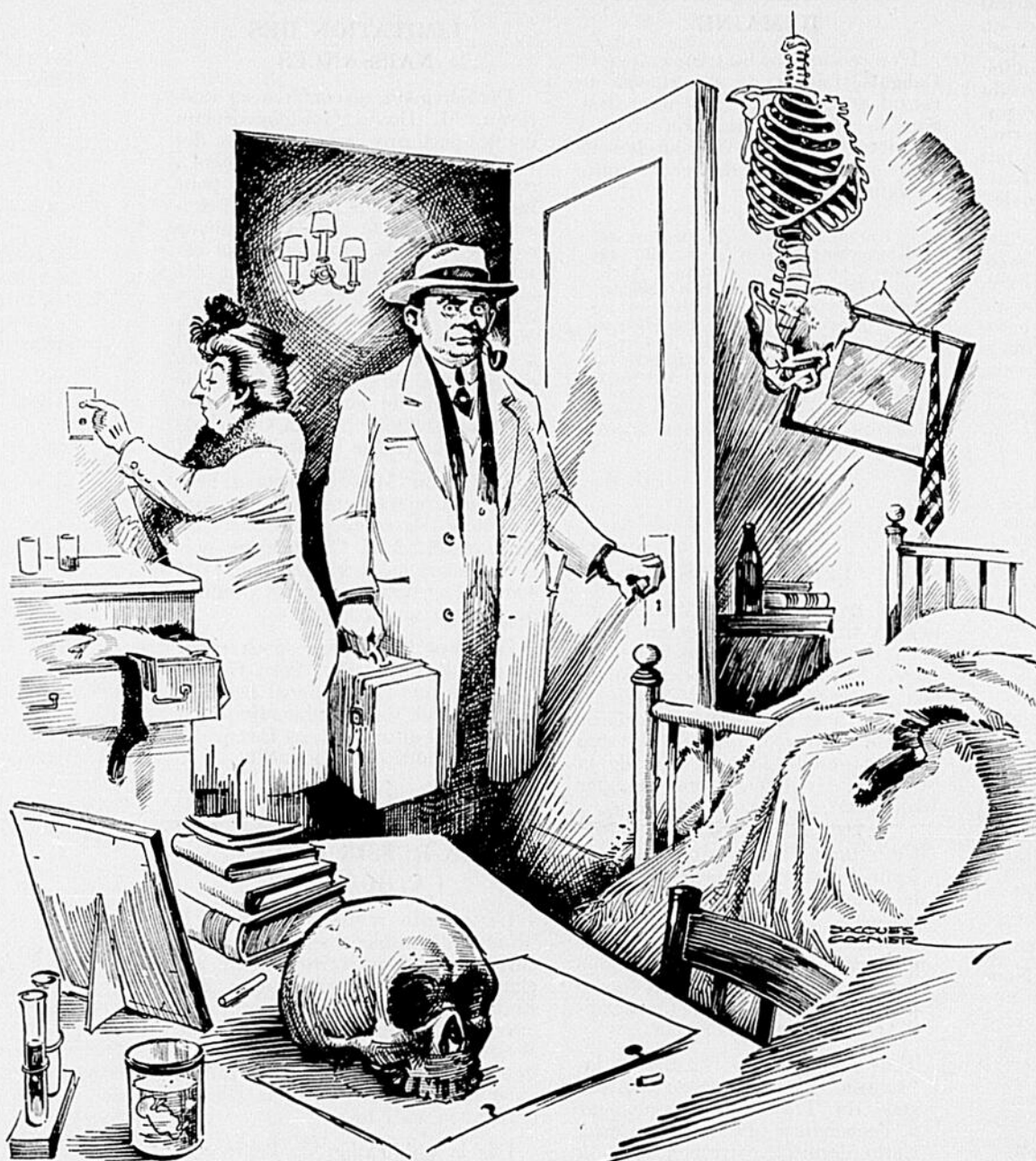
VISITE IMPROMPTUE CHEZ MON FILS ETUDIANT EN MEDECINE...