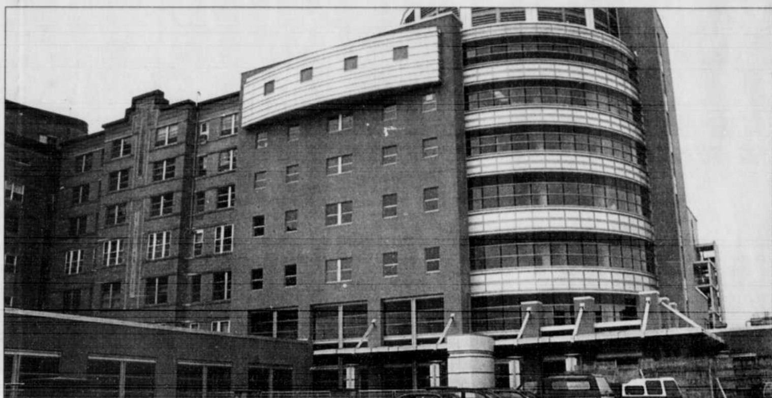
Les usagers de l'hôpital de Rimouski devront composer avec des listes d'attente plus longues et des fermetures durant les longs congés.

PLAN DE REDRESSEMENT DE L'HÔPITAL DE RIMOUSKI