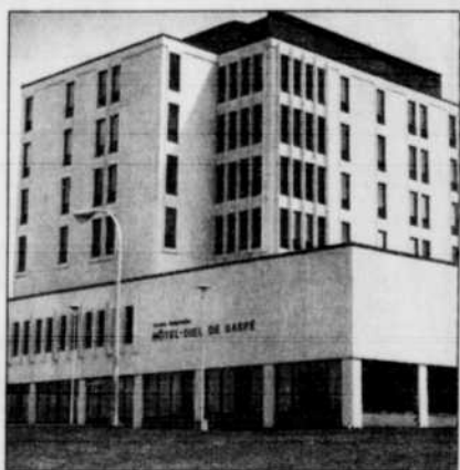
L'Hôtel-Dieu de Gaspé.

Le plan d'action qui en a résulté portait essentiellement sur la mise en place d'une structure d'encadrement commune aux deux organisations de même que sur le regroupement de tous les services des deux établissements. Un comité d'actualisation fut mandaté pour