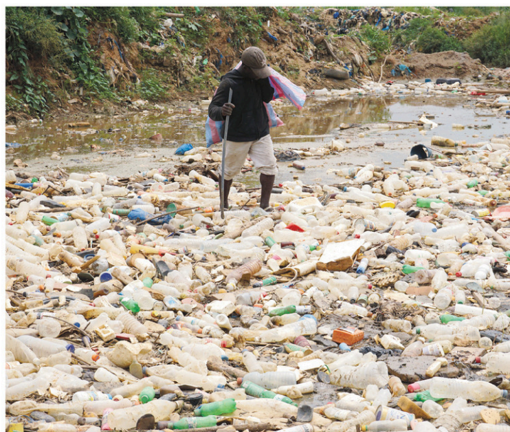
Un Ivoirien cherche des objets de valeur dans un amas de déchets, surtout de plastique, près d'Abidjan.