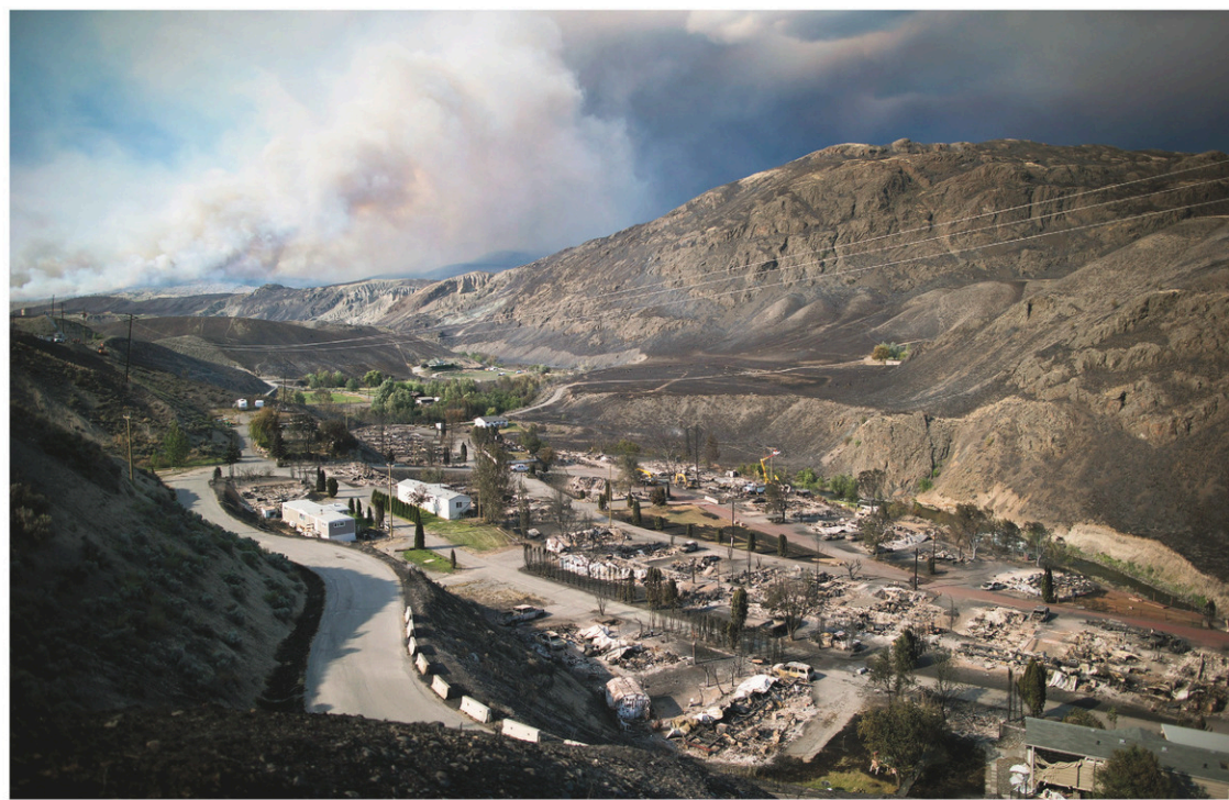
Des maisons détruites par le feu à Boston Flats. L'état d'urgence devait d'abord prendre fin vendredi.