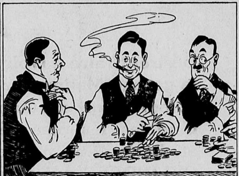
Tu commences d'abord par observer tes compagnons d'un oeil entendu puis, sûr de toi, tu y vas hardiment de tous les jetons.