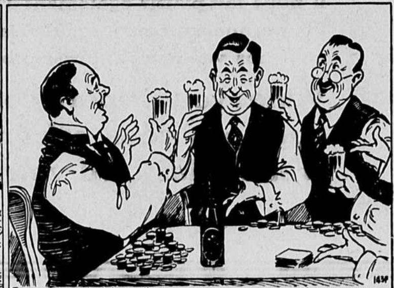
Après pareille bétise, il n'y a qu'un bon verre de BLACK HORSE pour te faire retrouver ton sourire!