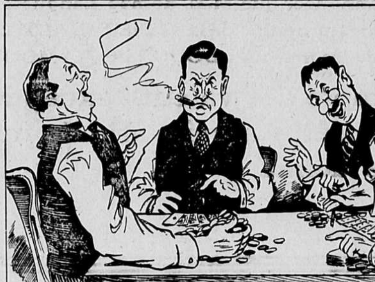
mais quand vient le moment de mettre les cartes sur la table tu constates avec terreur que tu as confondu un dix de carreau avec un dix de cœur.