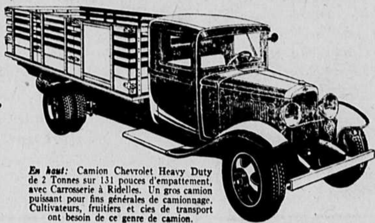
En haut: Camion Chevrolet Heavy Duty de 2 Tonnes sur 131 pouces d'emplacement, avec Carrosserie à Ridelles. Un gros camion puissant pour fins générales de camionnage. Cultivateurs, fruitiers et cles de transport ont besoin de ce genre de camion.

CHEVROLET offre maintenant une incomparable économie de gazoline, d'huile et d'entretien dans le domaine du camionnage lourd. De plus, tous les nouveaux Camions Heavy Duty de 2 Tonnes de la ligne Chevrolet sont construits pour un dur travail de camionnage lourd.