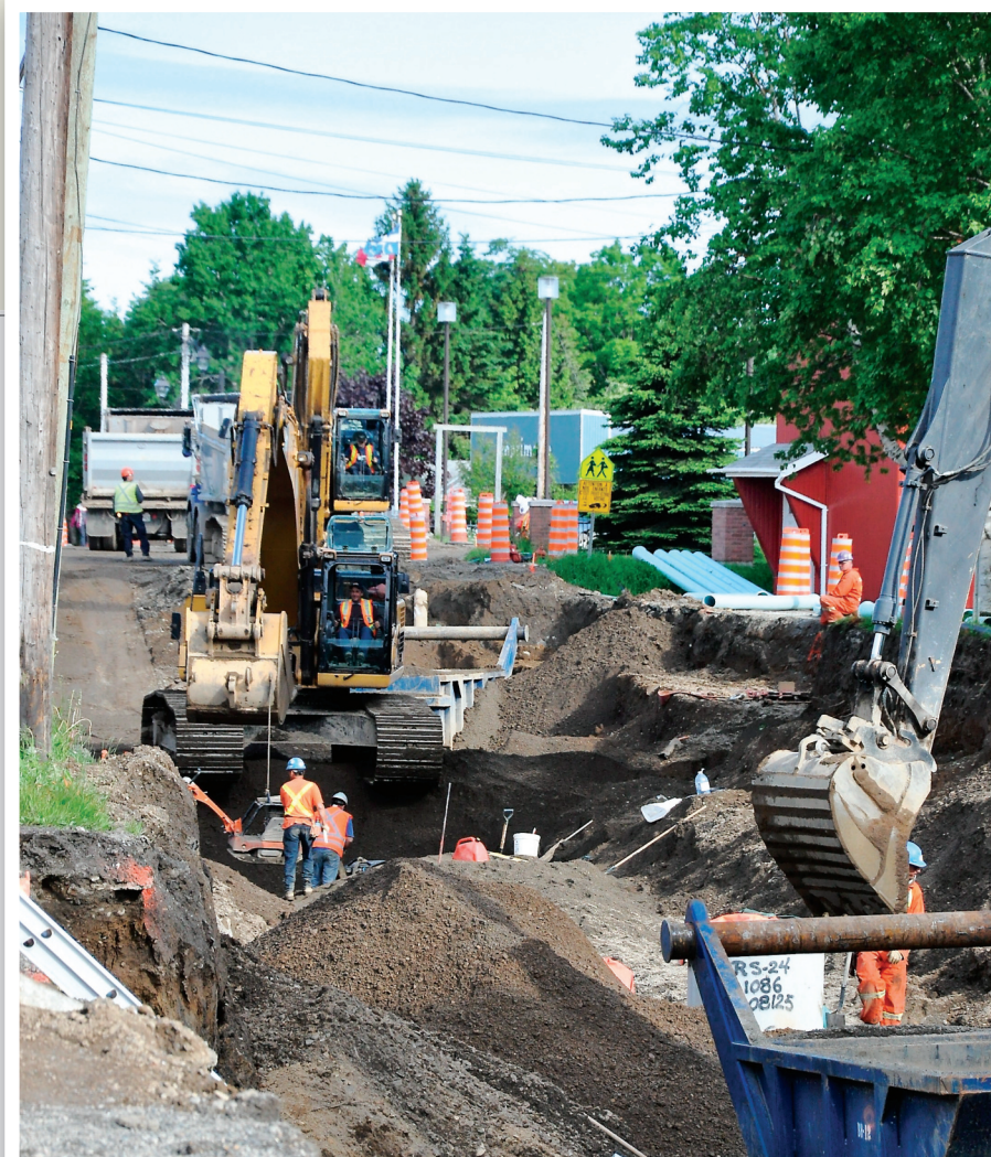
Plusieurs municipalités gaspésiennes auront désormais les moyens pour exécuter des réparations à leurs infrastructures.

Source : Steven Keighan, Coordonnateur du projet « Second souffle : de l'oxygène pour les personnes proches aidantes ». 418 680-2307.