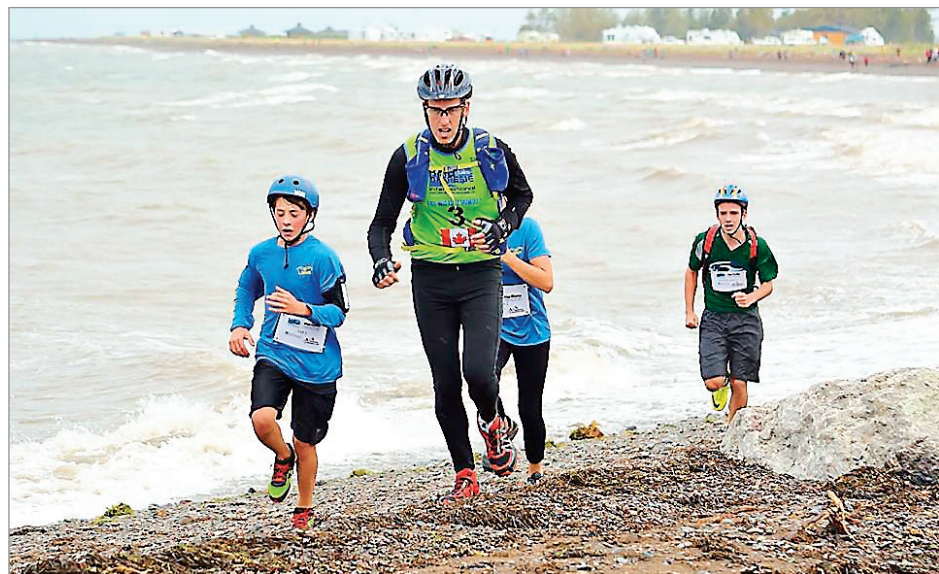
Les jeunes du secondaire de la CSRL dans la cour des grands, une première en Amérique du Nord!

Félicitations aux élèves pour leur participation et aux enseignants pour la mobilisation!