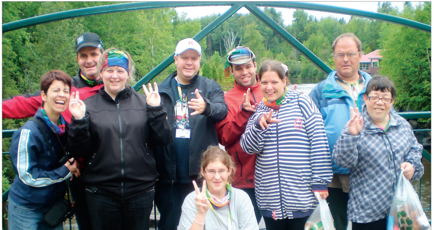
Une partie des membres au Zoo de Saint-Félicien.

d'envergure réunissant plus de 400 personnes de partout au Québec vivant avec un handicap physique ou une déficience