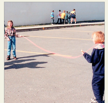
Plusieurs écoles de la CSRL pourront amorcer des travaux pour améliorer la qualité des cours d'écoles.

L'aide gouvernementale, servira à soutenir les projets suivants dans la Commission scolaire René-Lévesque (ces projets reçoivent la somme de 25 000 $ chacun) : Couvent de l'Assomption (Percé) : aménagement de surfaces récréatives et installation d'un module de jeux avec des aires de détente. École aux Quatre-Vents (Bonaventure) : aménagement d'une patinoire. École des Audomarois (Carleton-sur-Mer) : aménagement de surfaces récréatives et installation d'un module de jeux avec des aires de détente et des îlots de verdure. École des Découvertes (Saint-Siméon) : aménagement de surfaces récréatives et installation d'un module de jeux avec des aires de détente et des îlots de verdure. Polyvalente de Paspébiac et école La Source (Paspébiac) : réfection des terrains de tennis. Saint-Joseph-Saint-Patrick (Chandler) : aménagement de surfaces récréatives et installation de modules de jeux