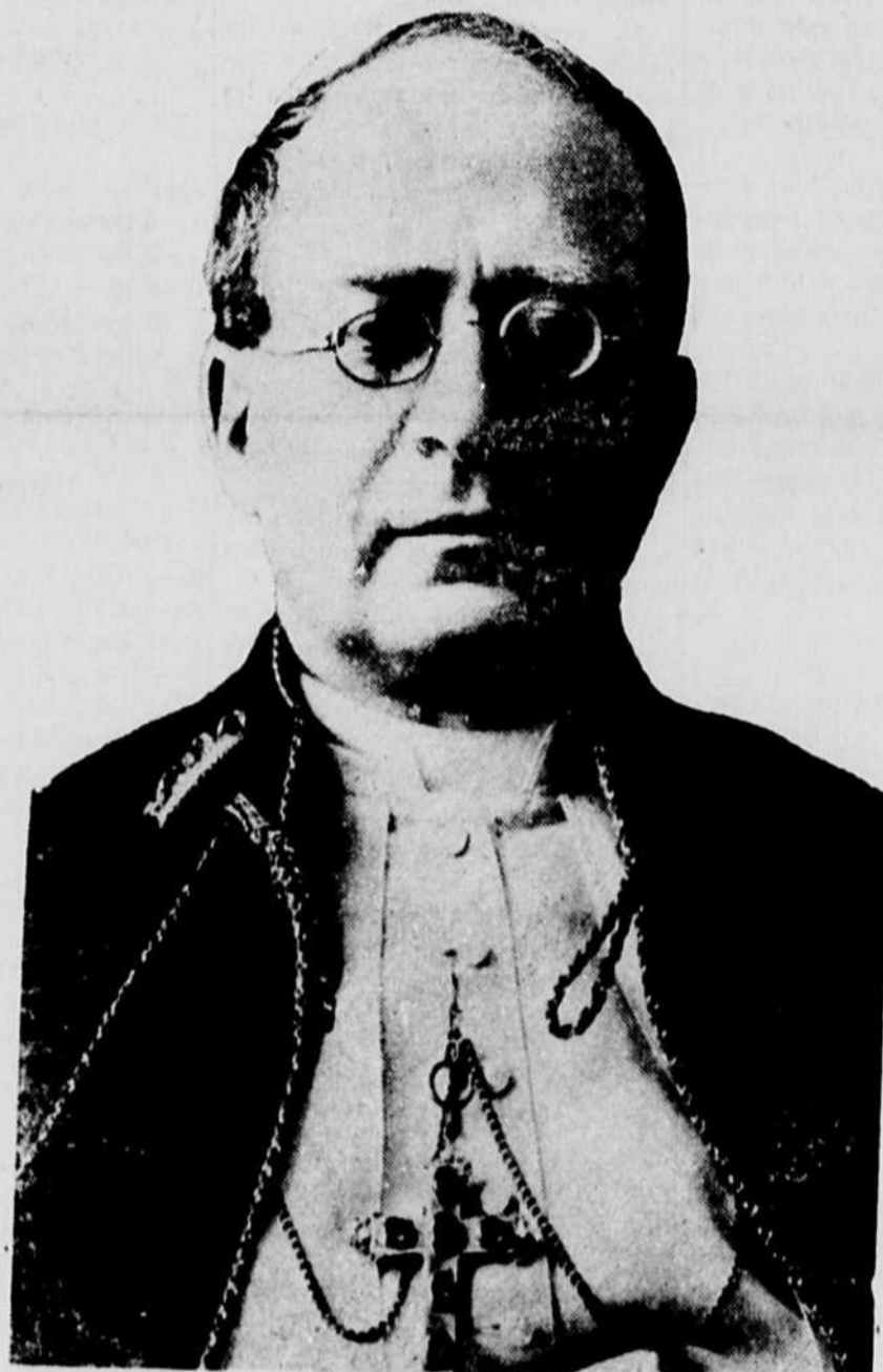
• Sa Sainteté le Pape Pie XI décédé après 17 années et quelques jours d'un des plus glorieux pontificats. Achille Ratti, Pape de la Paix, aurait eu 82 ans le 31 mai prochain.