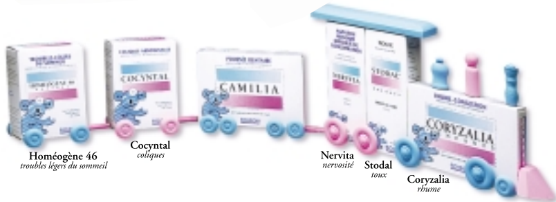
Homéogène 46 troubles légers du sommeil