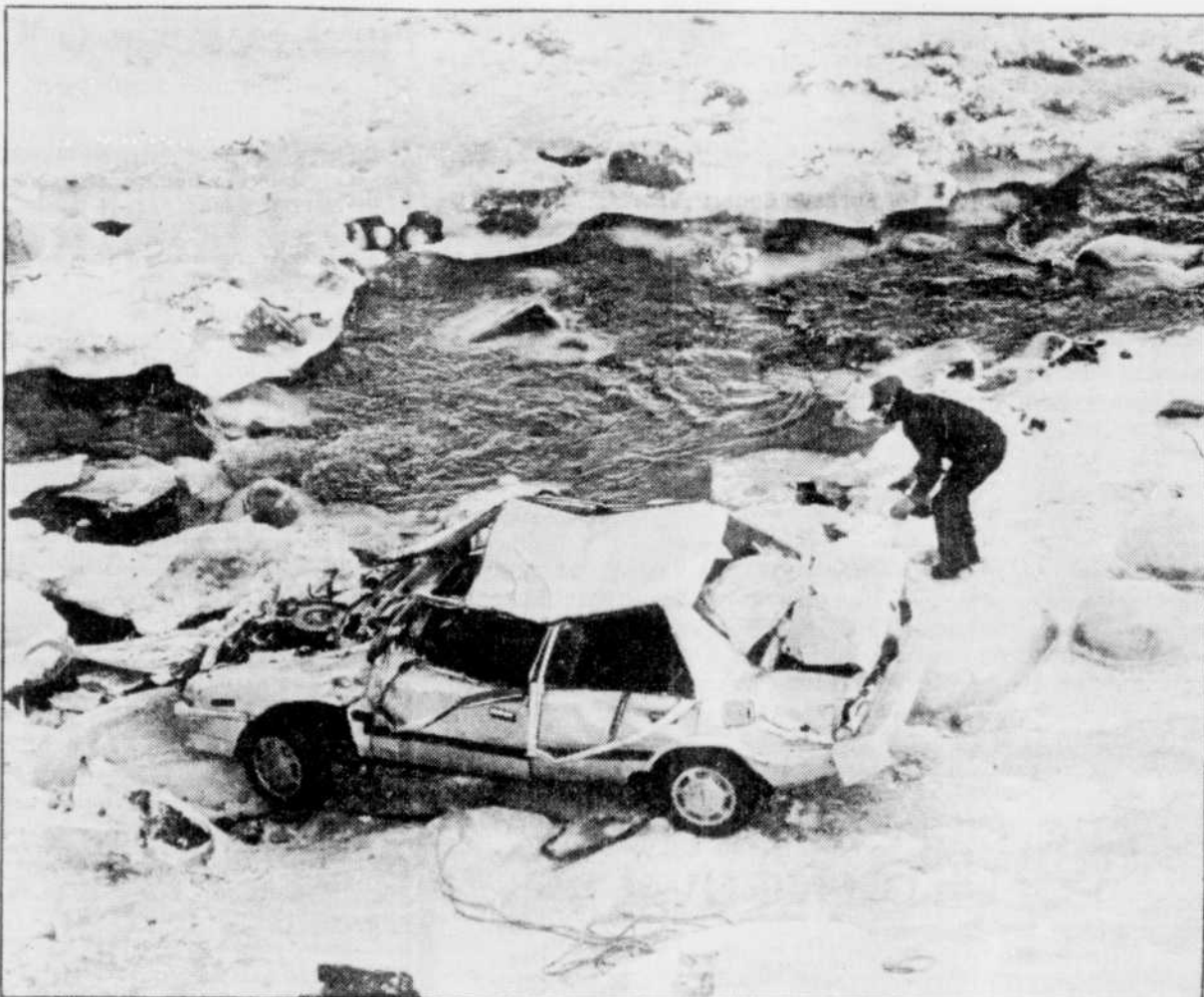
Collaboration spéciale, Pierre Rochette

Le véhicule a percuté le parapet du pont de la rivière Noire, pour ensuite tomber dans un ravin d'une vingtaine de mètres de profondeur.