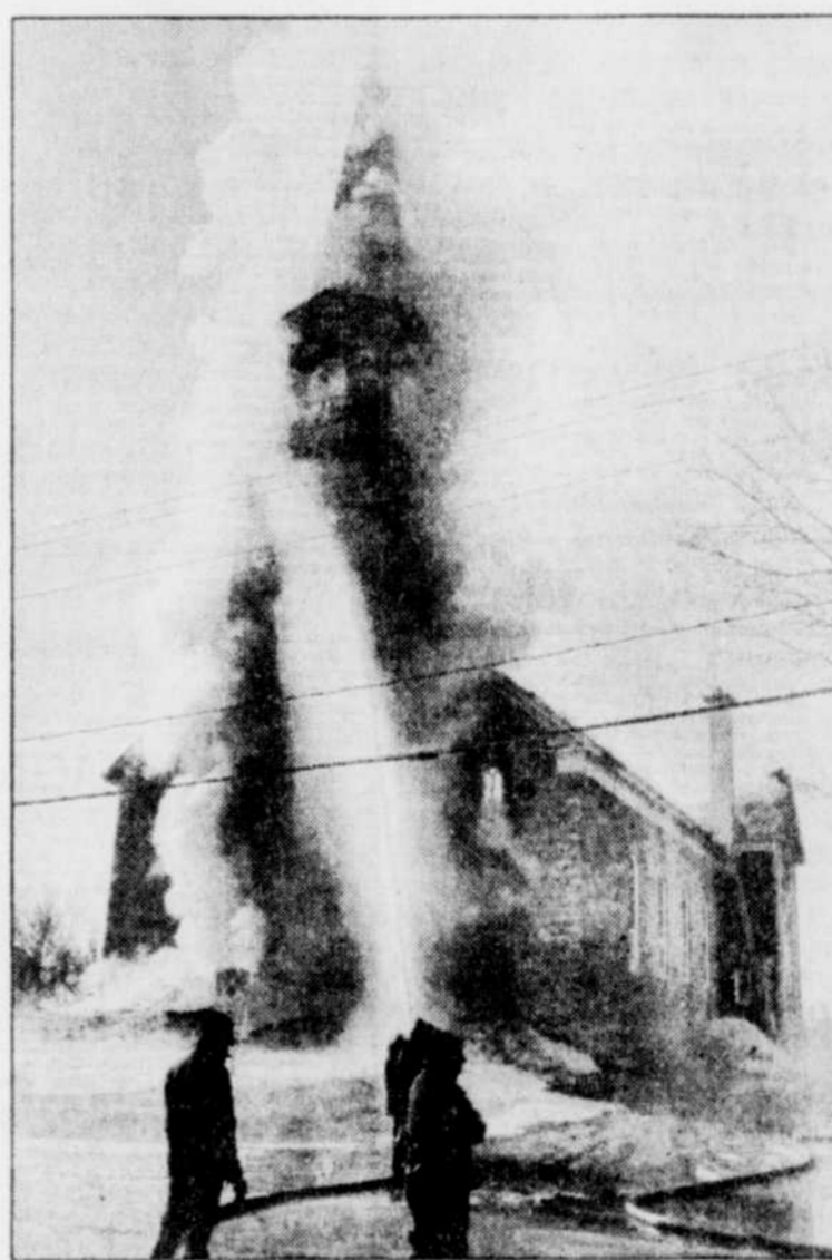
Lorsque les flammes ont commencé à s'attaquer au clocher, les pompiers ont dû s'éloigner, par mesure de précaution.

L'abbé Godbout ne cachait pas sa désolation de voir s'envoler en fumée un monument que ses paroissiens avaient rénové, lors de différentes corvées, en vue des célébrations du 75 e anniversaire de fondation de la