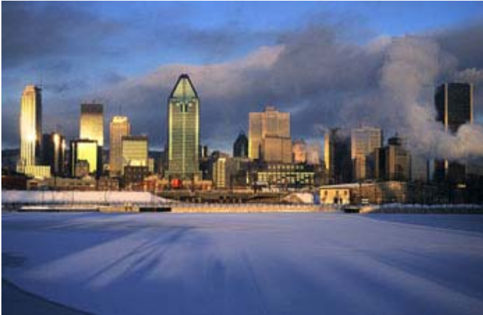
Montréal en hiver par Bertrand Lemeunier

Le photographe Bertrand Lemeunier partira en tournée à travers le Canada pour aider la Fondation Rêves d'enfants . Il effectuera ce voyage en bicyclette, de mai à décembre 2007, et il en profitera pour prendre des photos qu'il publiera dans un livre en 2008.