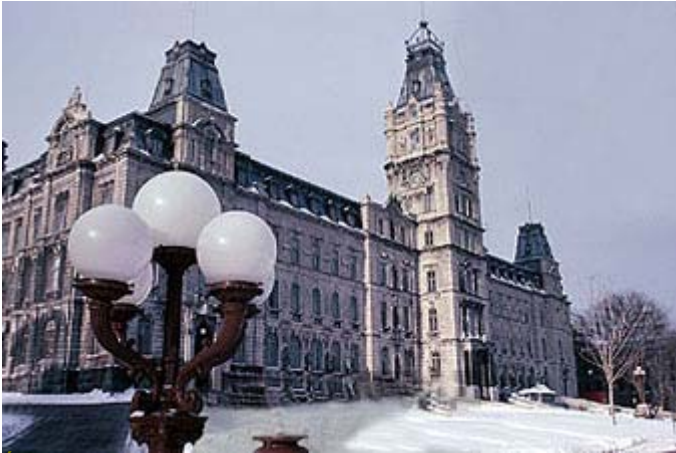
Edifice de l'Assemblée nationale du Québec

Le jour J (26 mars) est arrivé pour les politiciens québécois alors que les électeurs décideront par qui ils veulent être dirigé durant les 4 prochaines années.