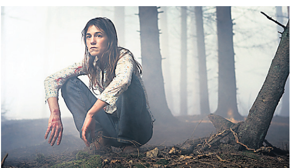
Charlotte Gainsbourg dans Antichrist de Lars Von Trier.