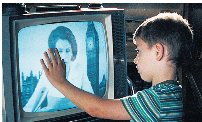
Maman est chez le coiffeur , de Léa Pool