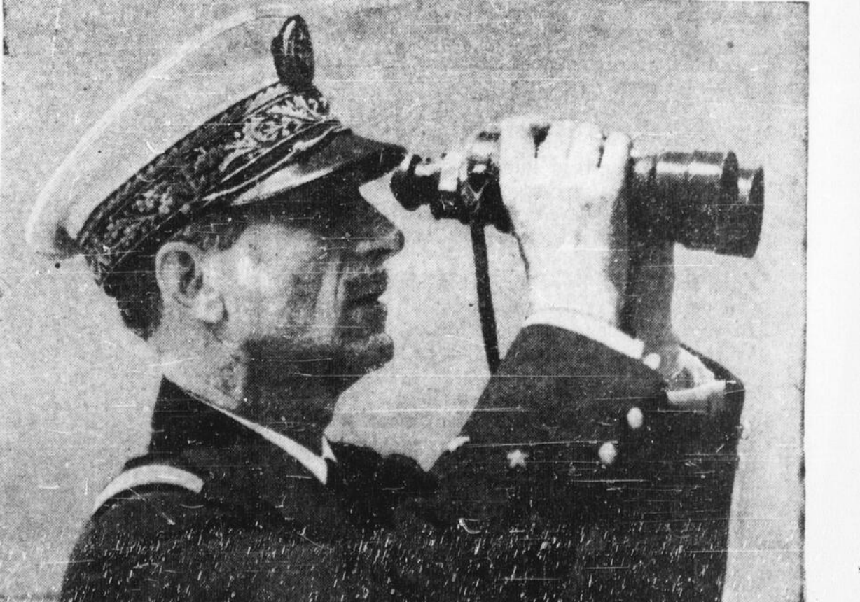
• LE VICE-AMIRAL René-Emile Godfrey, photographié à bord du vaisseau-amiral de l'escadre française d'Alexandrie, (Egypte). On sait que ces navires, un cuirassé, quatre croiseurs, plusieurs destroyers, un sous-marin et quelques petits navires auxiliaires sont passés, ces jours derniers, sous le commandement suprême du général Henri Giraud.

Le message dit que les personnes de Tokio bordaient les rues pour voir passer le cortège funèbre. Yamamoto était revêtu de son uniforme de camp et porté sur un affût de canon par des matelots. Les principaux officiers navals et militaires du Japon ont pris part à la procession.