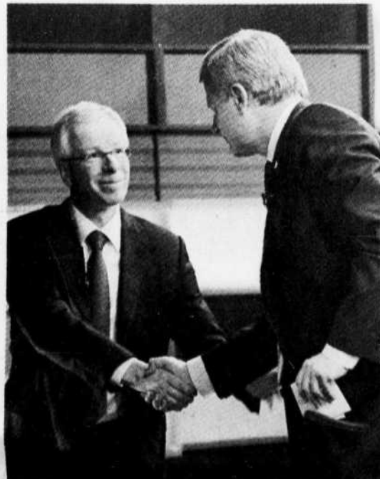
Stephen Harper et Stéphane Dion mercredi soir.

Revenons à la campagne électorale. Ce que je lis, c'est qu'il n'y a pas de thèmes, pas d'enjeux qui semblent toucher la population. Aux stratèges du Parti libéral, je proposerais de demander à Stephen Harper pourquoi il veut détruire le Canada.