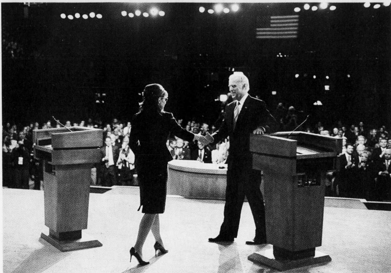
Le débat de jeudi n'a pas été le moment crucial qu'attendait John McCain pour relancer une campagne fragile.

Le Devoir se fait un plaisir de publier dans cette page les commentaires et les analyses de ses lecteurs. Etant donné l'abondance de courrier, nous vous demandons de limiter votre contribution à 8000 caractères (y compris les espaces), ou 1100 mots. Inutile de nous téléphoner pour assurer le suivi de votre envoi: si le texte est retenu, nous communiquerons avec son auteur. Nous vous encourageons à utiliser le courriel (redaction@ledevoir.com) ou un autre support électronique, mais dans tous les cas, n'oubliez pas d'indiquer vos coordonnées complètes, y compris votre numéro de téléphone.