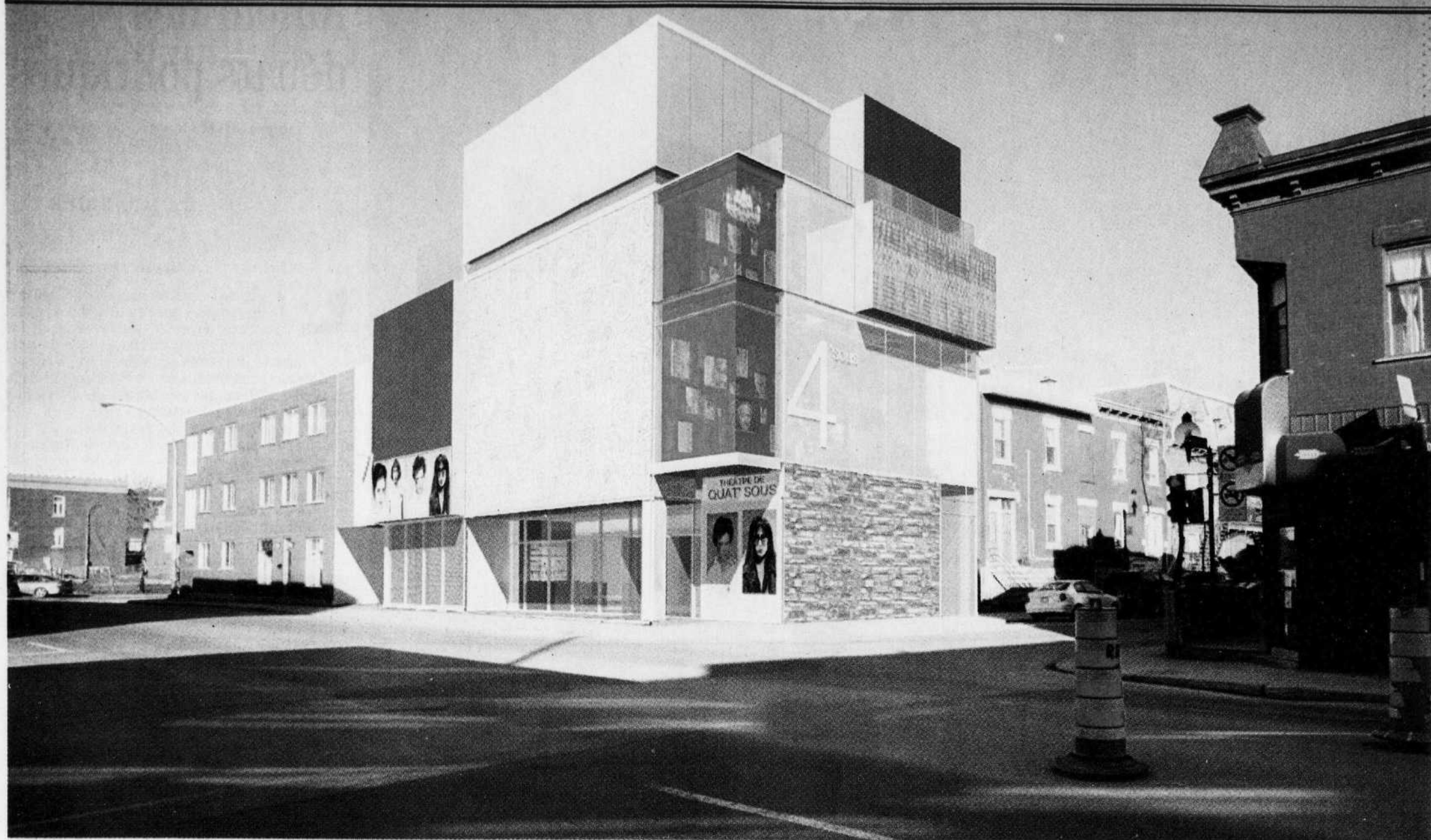
Le futur Théâtre de Quat'Sous, à Montréal.