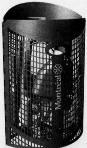
Le nouveau bac-sac de recyclage conçu par la firme montréalaise Claude Mauffette design industriel.

■ A consulter: www.ville.montreal.qc.ca/designmontreal , www.unesco-paysage.umontreal.ca , http://montreal.pecha-kucha.ca .