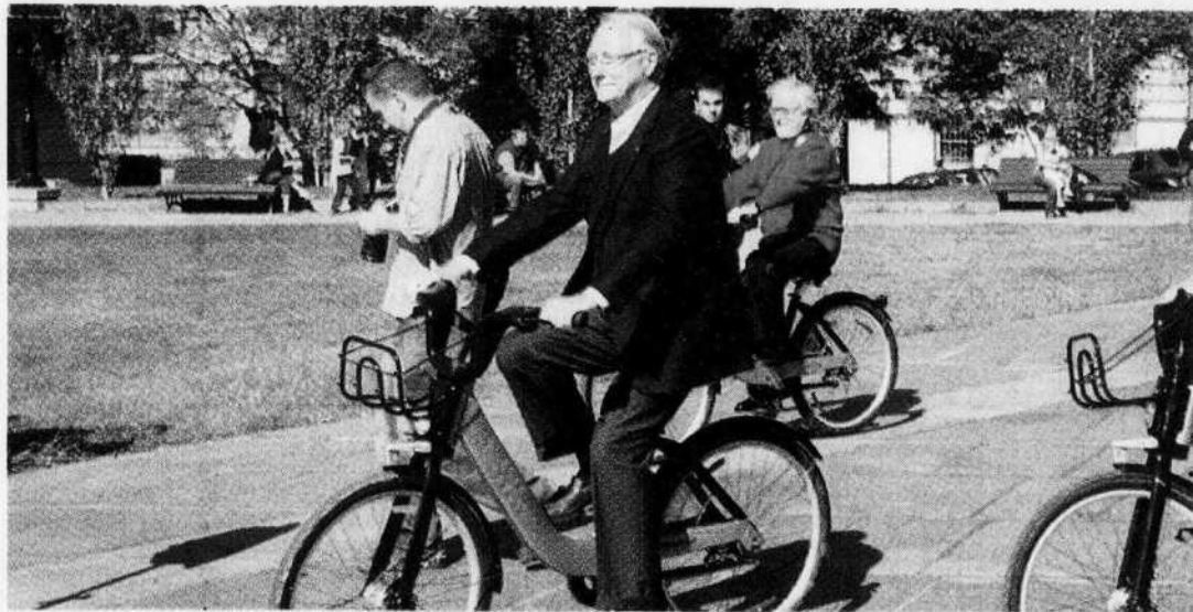
Le maire de Montréal, Gérald Tremblay, sur un Bixi, le vélo qui sera en libre-service en 2009.

Les élus ont exprimé leur souhait d'améliorer leur arrondissement sans savoir parfois par quel bout commencer... La grande absence de la soirée, c'était une vision d'ensemble, forte et structurée. Est-ce dû à un manque de culture ou de références en aménagement? On peut espérer que tous ceux et celles qui s'intéressent à l'amélioration de la qualité de l'environnement urbain (élus, promoteurs, gestionnaires municipaux, professionnels de l'aménagement, etc.) liront Les Cahiers des bonnes pratiques en design - Imaginer, réaliser la ville du 21 e siècle conçus par Design Montréal. Ces trois cahiers offrent une multitude d'exemples pour inspirer leurs démarches et des outils pour guider leurs interventions.