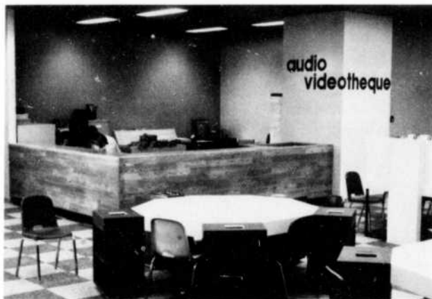
Vue partielle de l'audiovidéothèque montrant le comptoir du prêt derrière lequel se trouve l'entrepôt du matériel didactique et les tables intégrées d'écoute et de visionnement individuels.

Si le concept d'une bibliothèque aménagée en fonction d'une utilisation individuelle, adaptée aux besoins d'une pédagogie qui se dit et se veut sans cesse innovatrice, constitue un progrès tangible, il ne s'ensuit pas automatiquement que tous nos problèmes soient résolus! Penser constamment en termes de "polyvalence", "d'adaptation", de "si", de "peut-être", et de "au cas où..." exige un effort peu commun d'intégration et de coordination aux divers palliers techniques de la construction entre les architectes, les ingénieurs (en mécanique, en structure, en électricité, en audio-visuel!) et bien sûr, de temps à autre, le client!