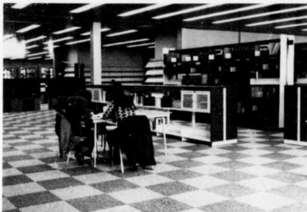
Espaces ouverts de travail avec, à l'arrière-plan, le fichier central et le salon des périodiques.