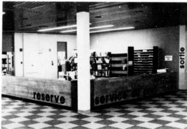
Un aperçu de l'ensemble des services au public conçus d'une façon intégrée et identifiés au moyen de super-graphiques. Les carreaux du tapis peuvent être remplacés unitairement.

-- le reste de cette surface, soit près des deux tiers est constitué d'aires ouvertes occupées par le rayonnage (approximativement 40000 documents écrits), les fichiers, les périodiques, les espaces de travail et la circulation.