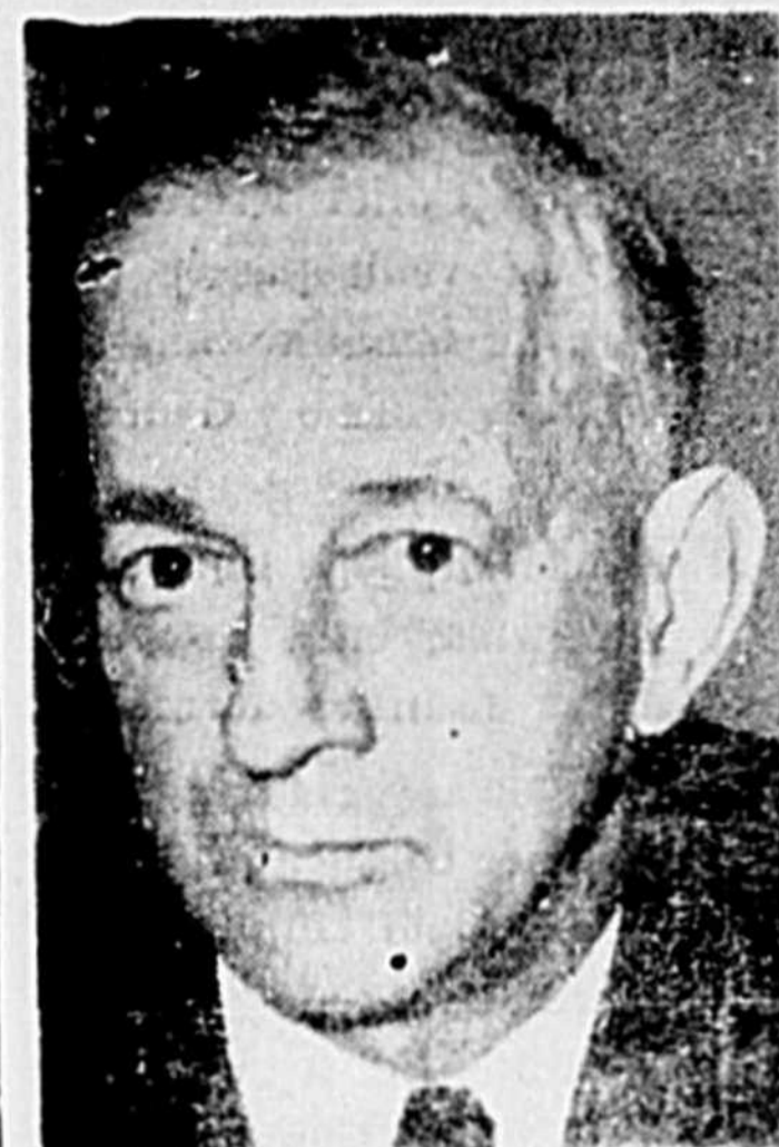
IL A RESIGNE

— C'est pour ça que je reviens cette semaine, j'ai huit jours de plus.