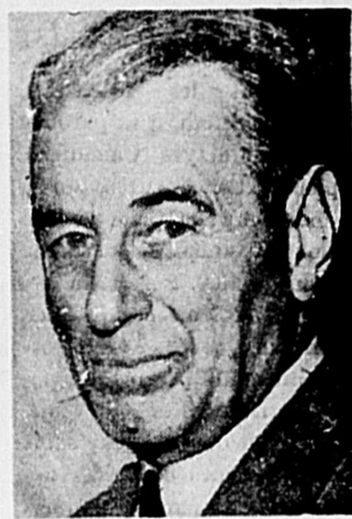
NOUVEAU PREMIER MINISTRE

L'hon. Harry Nixon qui a résigné ses fonctions dans le cabinet ontarien, peu après la démission de M. Hepburn.