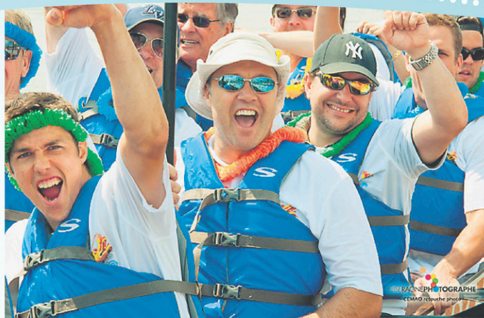
Le Défi EnBarque, qui se déroule au lac Boivin, auquel de nombreuses équipes participent à chaque année.

Bien entendu, ces activités servent à recueillir des fonds. Elles sont aussi un véhicule idéal pour faire connaître la Fondation et rejoindre le grand public. Ce sont des événements rassembleurs qui proposent des sorties en famille, entre amis ou entre collègues de travail. C'est aussi une occasion pour les gens de se mobiliser et ainsi contribuer