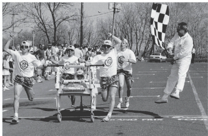
Une activité-bénéfice très populaire à l'époque : la course de lits!

à la santé et au développement du CSSS de la Haute-Yamaska. Les activités-bénéfice génèrent d'ailleurs plus du tiers des revenus annuels.