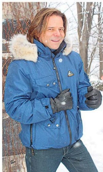
Rick Hughes de l'émission « La Voix ».

Ce renouveau pour Valanga a ouvert les portes sur un marché encore inexploité. Ce qui a permis à petite PME québécoise d'avoir une visibilité plus grande de ses produits et de promouvoir les produits