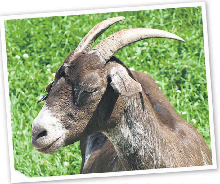
Une magnifique chèvre de race Kiko, de la Ferme Caprivoix, à Saint-Hilarion dans Charlevoix.

Nos chroniques habituelles reviennent aussi avec Guy Bourgeois, des produits testés pour vous et des idées pour vous gâter côté mode, accessoires et beauté.