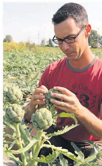
Peu nombreux sont ceux qui cultivent les artichauts au Québec.