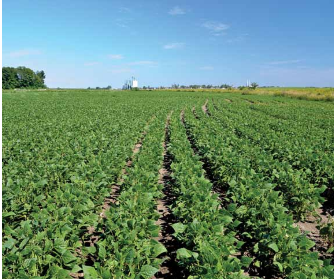
Champ de haricots de la région de St-Hyacinthe