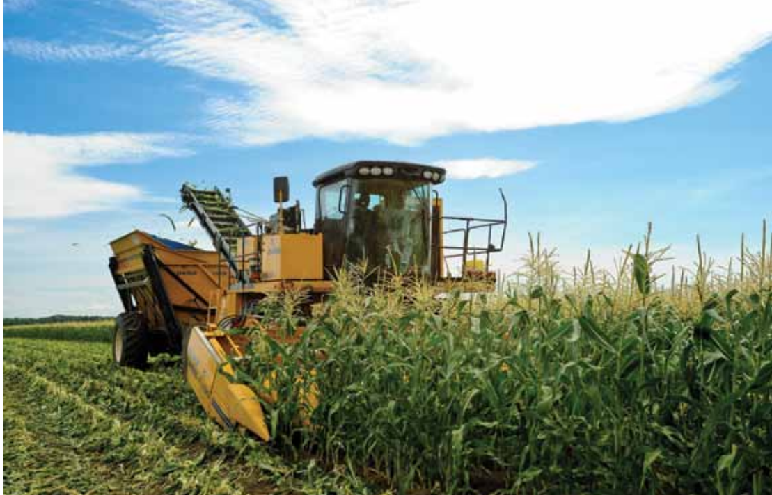
Champ de maïs sucré de la région de Saint-Hyacinthe