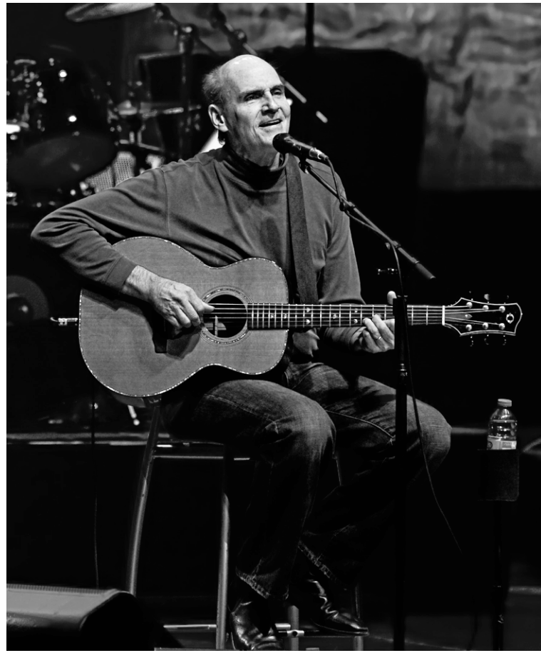
James Taylor n'avait pas renoncé à surprendre son public, hier soir.