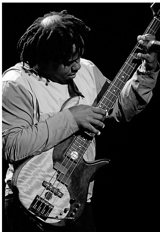
Victor Wooten et Stanley Clarke