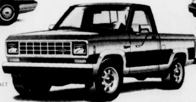
Ford Ranger XLT

*L'offre de remise en argent est offerte sur les modèles neufs 1987-88 ci-dessus mentionnés. À l'exception des modèles Escort L, LX et GT (1988). L'offre de remise en argent sur les pick-up Série F ne s'applique qu'aux modèles équipés d'une boîte manuelle. Vous pouvez conserver la remise en argent en utilisant votre véhicule transaction. Vous devez faire votre choix parmi les modèles en stock chez le concessionnaire. Cette offre est d'une durée limitée. Voyez votre concessionnaire Ford ou Mercury pour plus de détails.