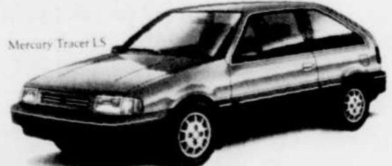
Mercury Tracer LS