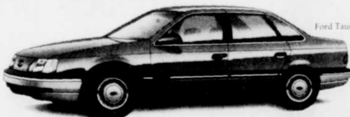
Ford Taurus GL