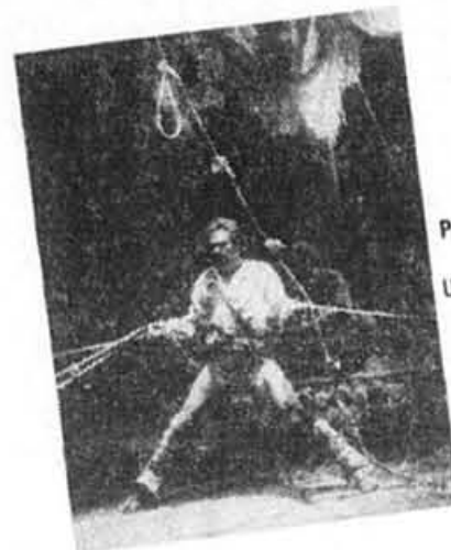
Pericles, Prince of Tyre Un Shakespeare futuriste

PERICLES, PRINCE OF TYRE (QUÉBEC) The Association of Producing Artists Studio théâtre Alfred-Laliberté (UQAM) 1455, rue St-Denis 26, 27 mai 22 h (13 $) 29 mai 19 h (15 $) 28 mai 19 h (13 $)