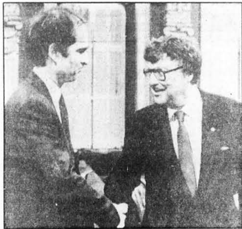
L'écrivain Roger Lemelin (à droite) échange quelques propos avec le ministre des Affaires intergouvernementales du Québec, Gil Rémillard, peu après avoir été invité à témoigner, à l'Assemblée nationale, devant la commission parlementaire chargée de débattre l'accord constitutionnel du lac Meech.

Ovationné à son arrivée, le chef d'Etat a reçu un accueil aussi chaleureux que le président américain Ronald Reagan, il y a quelques semaines. Même que cette fois-ci, personne n'a chahuté.