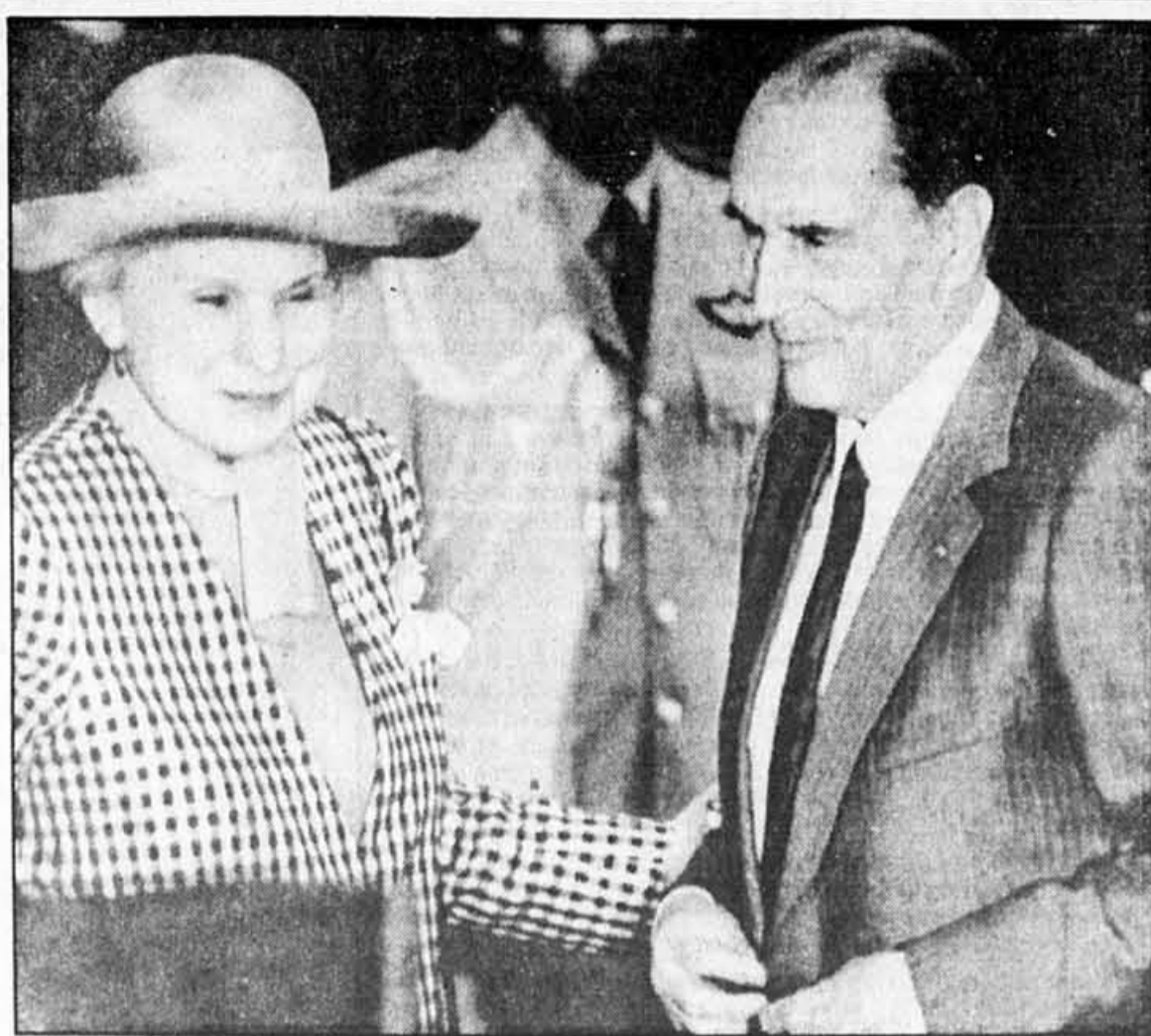
Le président français a été accueilli à l'aéroport d'Ottawa par le gouverneur général du Canada, Jeanne Sauvé.