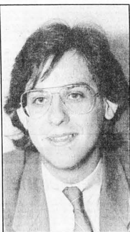
Alain Lefèvre: plusieurs concerts à Montréal et ailleurs.

Le programme : Sonate en mi bémol majeur (Hob.XVI:52) de Haydn, La Terrasse des audientes du clair de lune , de Debussy (extraits des Préludes), Scarbo , de Ravel (ext. de Gaspard de la Nuit ), Variations , de Jacques Hétu, et Sonate en si mineur de Liszt.