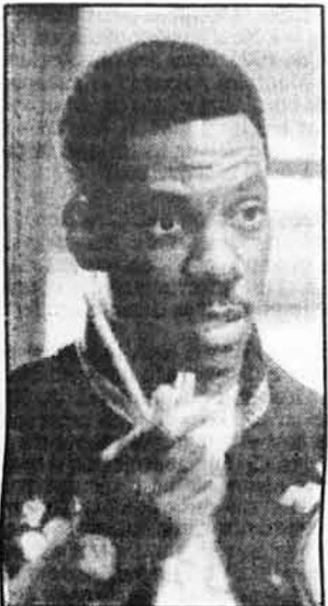
Eddie Murphy dans Beverly Hills Cop II .

« Et ce n'est que pour Montréal! Pour l'ensemble du Québec... »