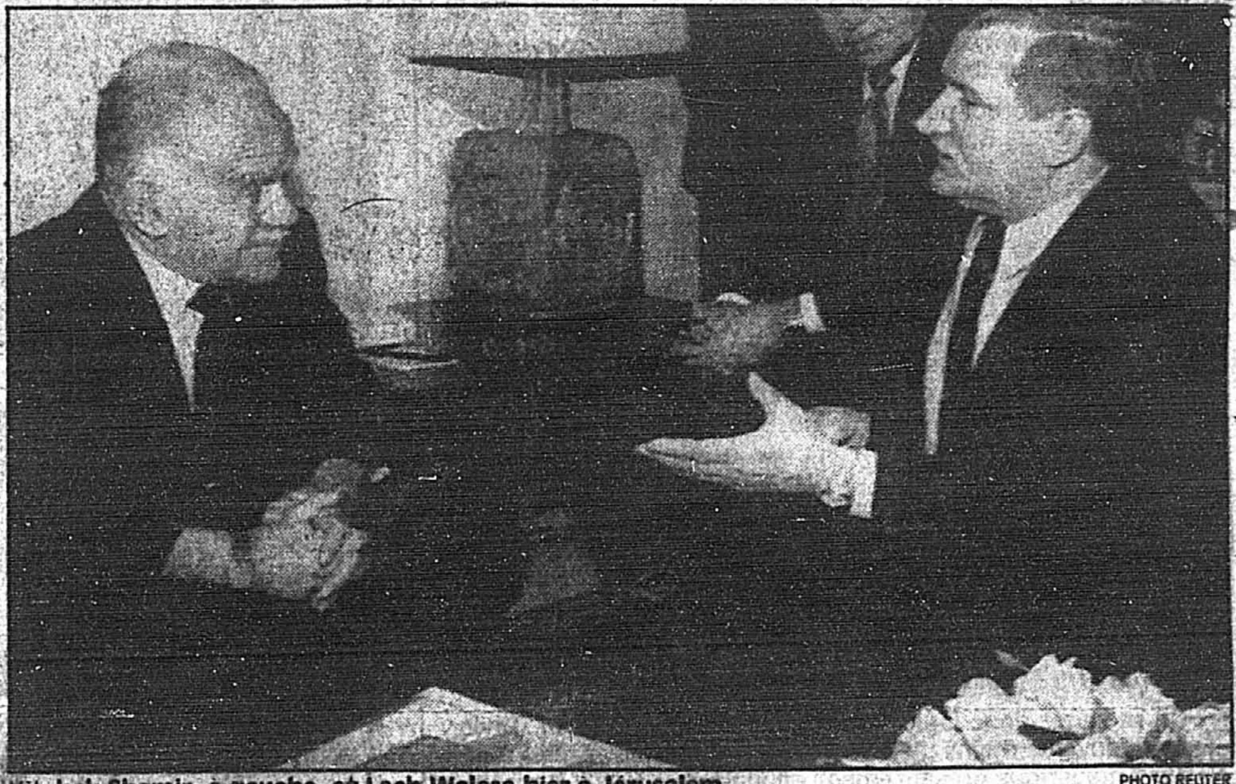
Yitzhak Shamir, à gauche, et Lech Walesa hier à Jérusalem.

« Comme représentant de la Pologne libre et indépendante, a-t-il dit, je vous demande aussi de faire preuve d'équité dans vos souvenirs et de vous rappeler que