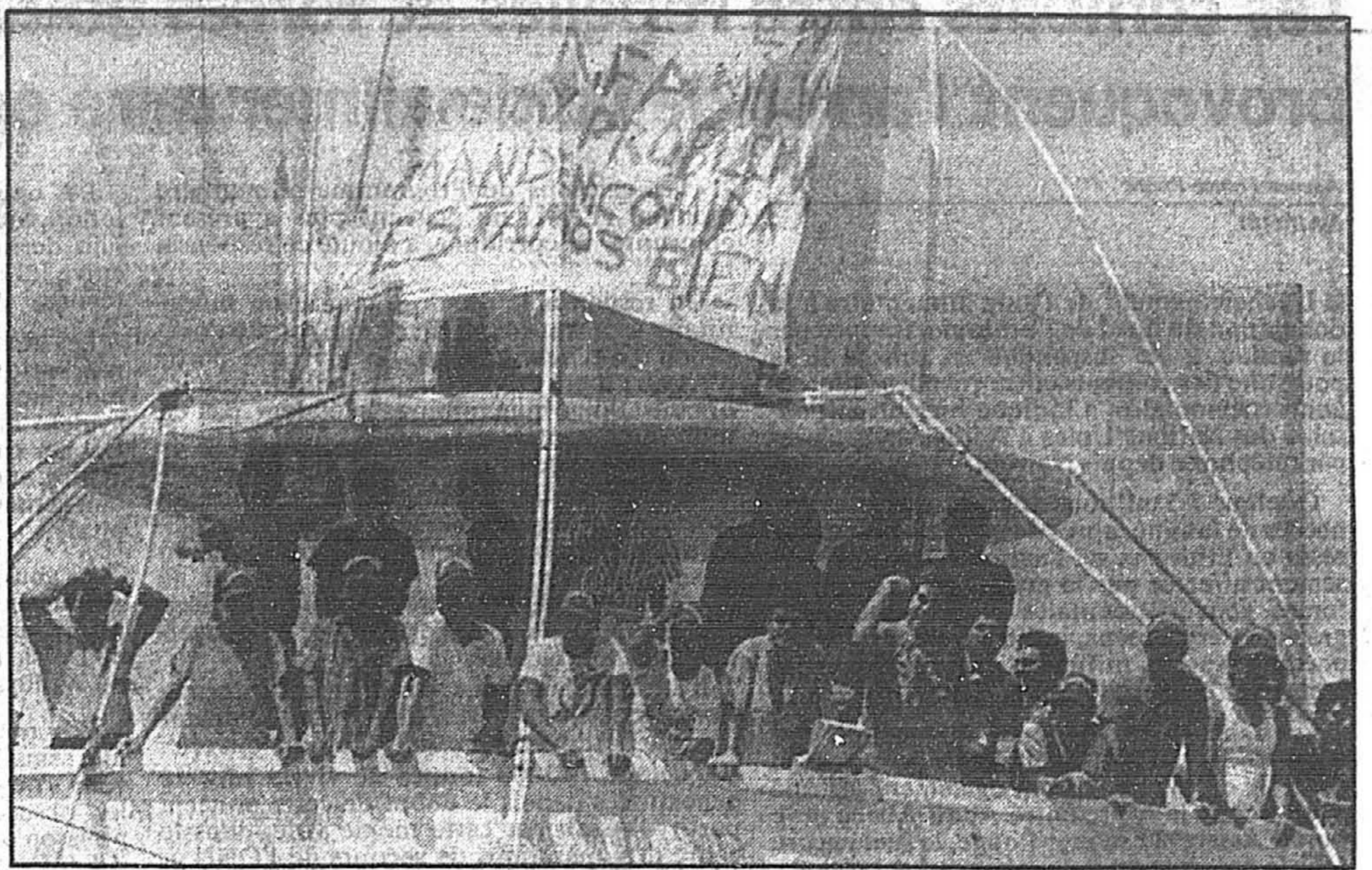
Les mutins de la prison de Matamoros ont déployé une affiche où ils réclament des vivres en affirmant que tout va bien à l'intérieur.