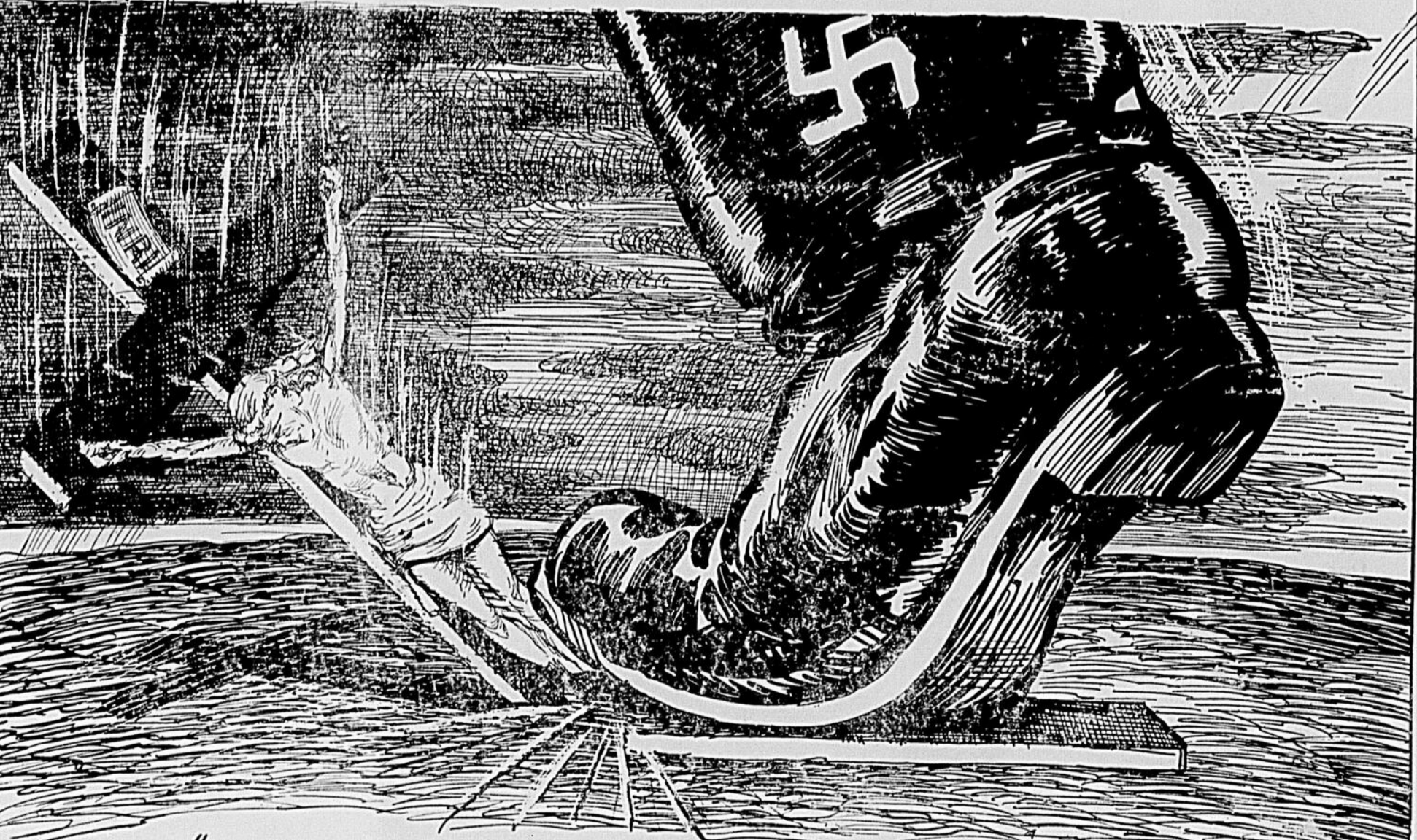
"NOUS NE VOULONS RIEN AVOIR À FAIRE AVEC LE CHRISTIANISME... LE PRÉTENDU DIEU NE DONNE AUCUNE MANIFESTATION DE SON EXISTENCE AUX JEUNES, MAIS, SI ÉTRANGE QUE CELA PUISSE PARAITRE IL LAISSE CE SOIN EN DÉPIT DE SA TOUTE-PUISSANCE, AU CLERGE... SI NOUS, NATIONALS-SOCIALISTES, PARLONS DE LA 'FOI EN DIEU' NOUS NE SONGEONS PAS AU MÊME DIEU QUE LES NAÏFS CHRÉTIENS." MAX BORMANN DAN LE NOUVEL ÉVANGILE NAZI