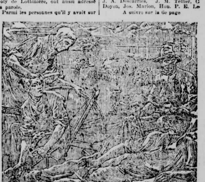
L'un des bas-reliefs qui ornent le monument de Sir John Macdonald.