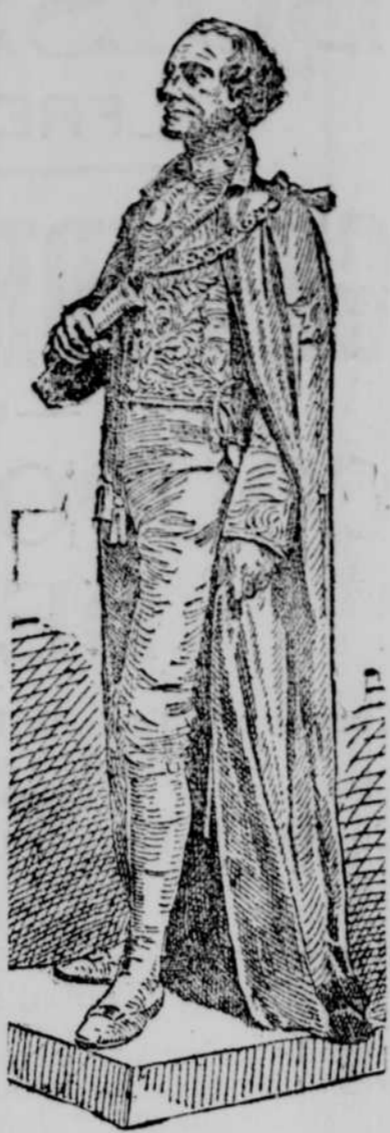
La statue de sir John Macdonald sous l'arc de triomphe de la place Dominion.

S'il eut des adversaires déterminés, il eut des amis dont le dévoilement fut admirable. Il eut des collaborateurs éminents, puissants par la force que donne le faveur populaire à ceux qui l'ont acquise par l'intelligence, le travail et la loyauté; le nom du plus illus-