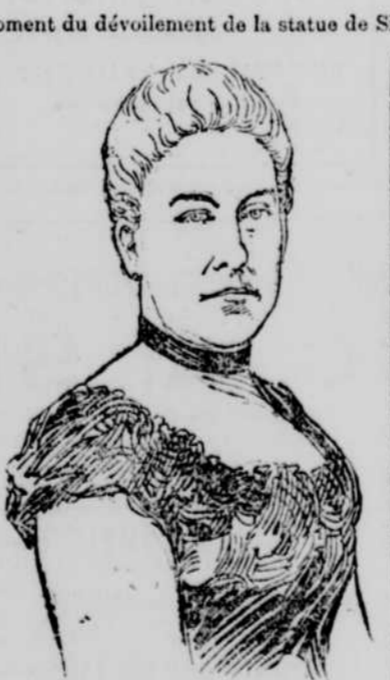
La baronne d'Earncliffe, veuve de sir John Macdonald.

Depuis le hardi navigateur qui, le premier, fit reculer la barbarie sauvage devant l'étendard fleurdelisé de la civilisation, jusqu'au vaillant colon qui ouvre la forêt primitive à l'action bienfaisante de l'agriculture et de l'industrie, tous ceux qui ont contribué à l'agrandissement du domaine national, à l'enoblissement de la patrie, ont droit à notre reconnaissance. Quelle doit être la gratitude nationale pour celui qui fut l'architecte de cette construction gigantes-que dont les fondations sont baignées par les vagues des deux grands océans, et qui a fait de ce Canada, "notre pays, nos amours", un pays dont les progrès font l'admiration du monde entier.