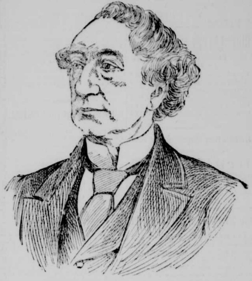
Sir John Macdonald dans les dernières années de sa vie

Aussi, est-ce avec le geste énergique de celui qui vient de dévoiler cette statue que nous devons faire tomber les préjugés, les prévention, les ressentiments, fussent-ils légitimes, qui pourraient obscurcir les clartés lumineuses que projette sur cette grande figure un demi-siècle d'efforts, de luttas, de travaux continus, pour le succès de l'idée grandiose dont sir John eut le bonheur de voir le couronnement avant de mourir. Son individualité personnelle est disparue dans la tombe, qui impose le respect pour ceux qu'elle abrite, la tombe sur laquelle une seule plante devrait fleurir, la plante du bon souvenir. L'antiquité plaçait ses héros dans l'Olympe, en les déifiant; le christianisme, dont l'Olympe est plus élevé, mit les siens dans ses temples et sur ses autels. Athènes et Rome placèrent leurs grands hommes dans leur Acropole et leur Panthéon; elles leur élevèrent des statues de bronze ou de marbre sur les places publiques, comme un enseignement vivant où les jeunes générations venaient prendre des leçons de patriotisme, de civisme héroïque, qui produi-