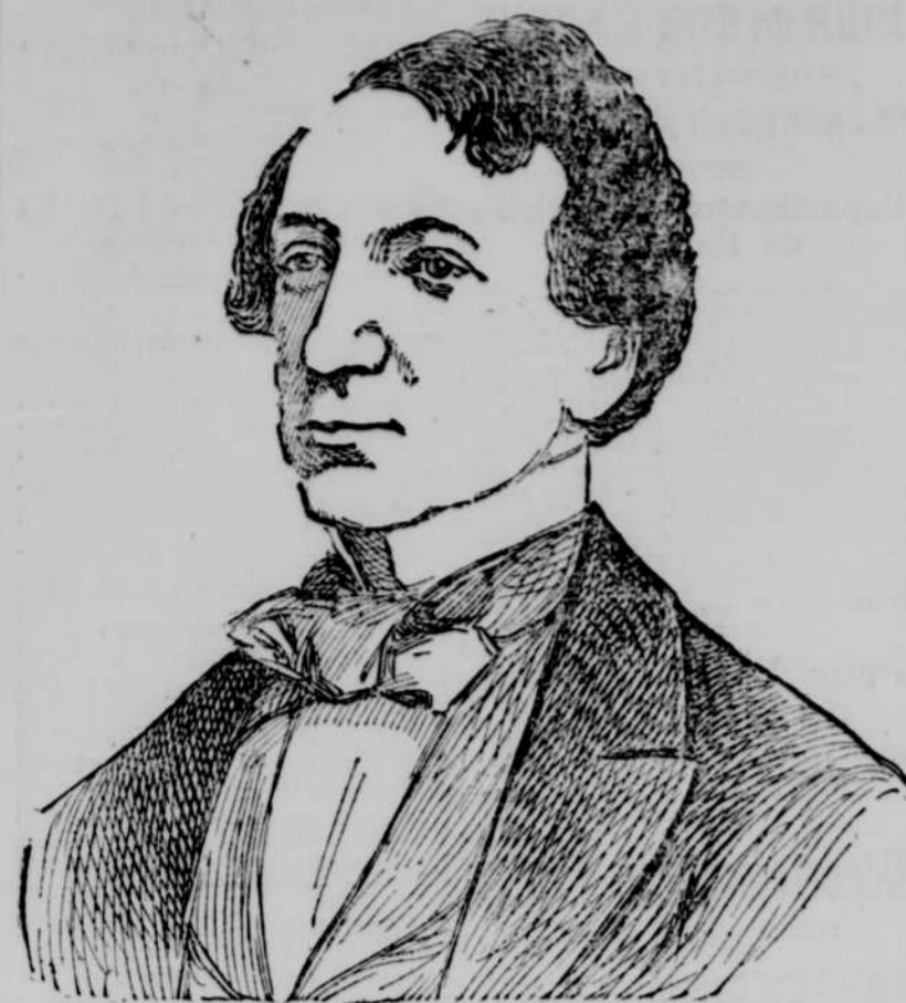
Sir John Macdonald à l'époque où le Parlement Canadien siégeait à Montréal

Inauguration du monument érigé à sa mémoire sur la place Dominion