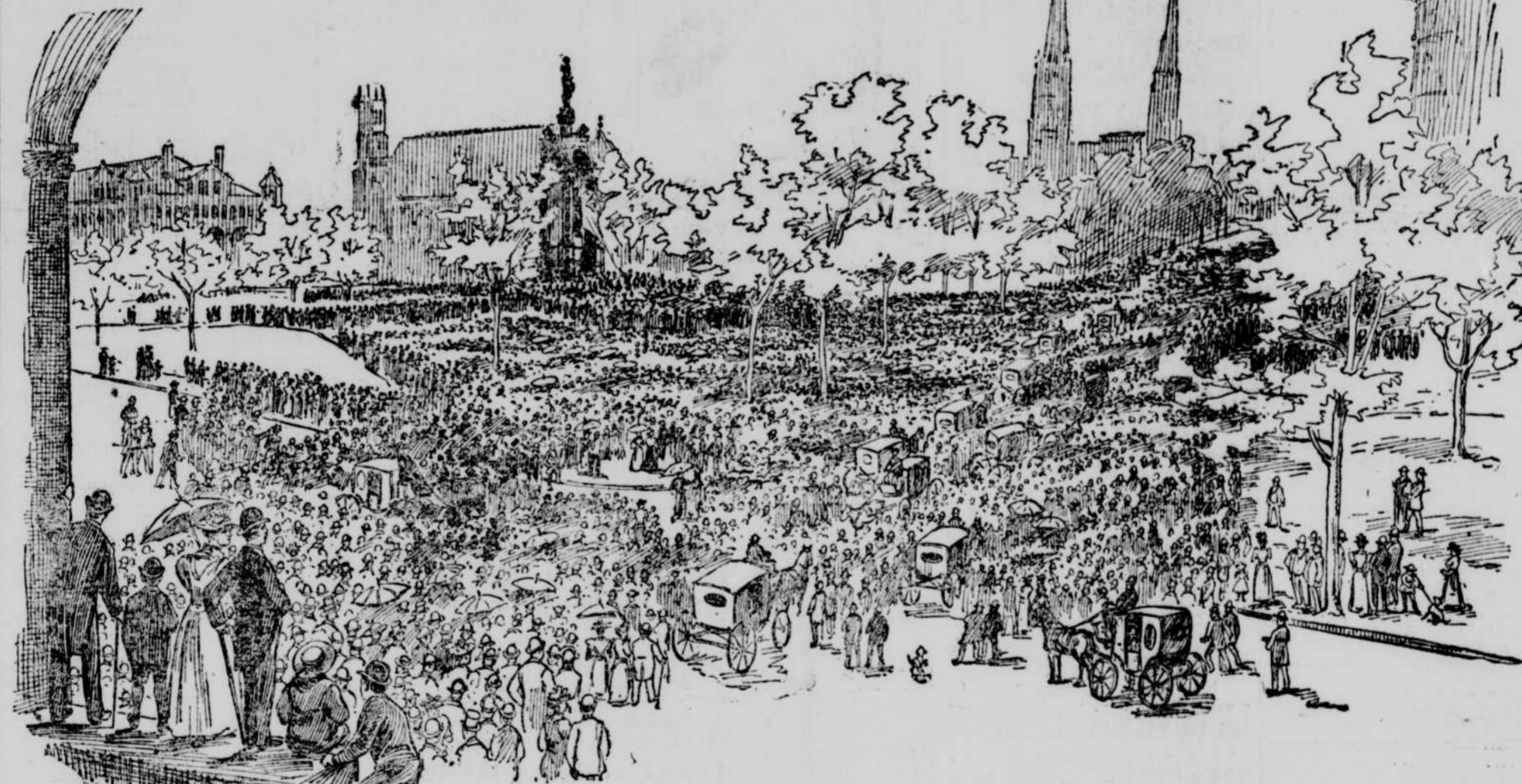
Spectacle de la place Dominion au moment du dévoilement de la statue de Sir John Macdonald, cette après-midi.

Aujourd'hui, après cinq années, c'est encore le même entrain; le nom de sir John attire autant la foule qu'alors; mais les sentiments qui l'animent sont différents. Ce n'est plus pour pleurer sa mort que le peuple s'assemble; mais pour rendre hommage à sa mémoire, pour honorer son vaste talent et perpétuer son souvenir par un monument, digne de lui, digne de ses œuvres et digne du pays qu'il a servi avec fidélité durant un demi siècle.