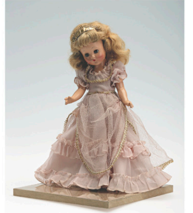
Poupée Cendrillon (1952-1953)