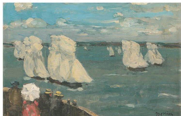
La régates (1902-1907), James Wilson Morrice

dère, dont les artisans ont travaillé en étroite collaboration avec l'équipe de designers et de conservateurs du musée.