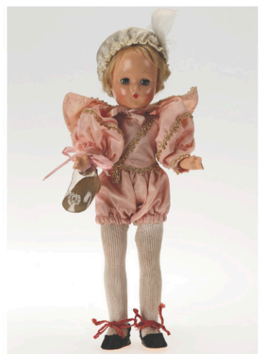
Poupée Prince charmant (1952-1953)