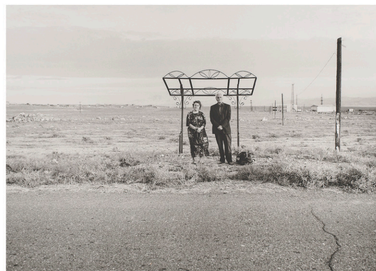
Hoktemberjan, Armavir (2000), Ursula Schulz-Dornburg

Autre attraction valant le détour au musée: les nouvelles salles d'art canadien et autochtone rénovées, dont l'inauguration a eu lieu un peu plus tôt cette année. Pour ce faire, le musée a bénéficié des services du Studio Adrien Gar-