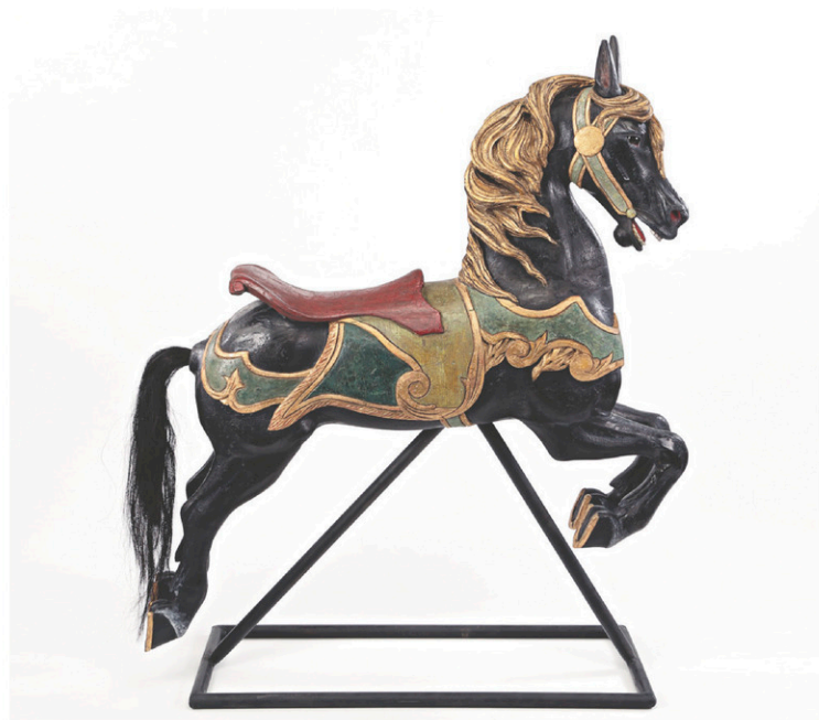
Cheval de carrousel (1900-1950)

«Les expositions de jouets marchent toujours très bien, elles viennent combler cer-