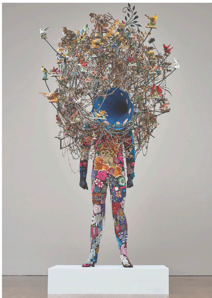
Soundsuit (2015), Nick Cave

Le MBAC présente aussi une exposition sur James Wilson Morrice. James qui? Rien de moins qu'un des plus grands peintres modernistes canadiens! « Né à Montréal,