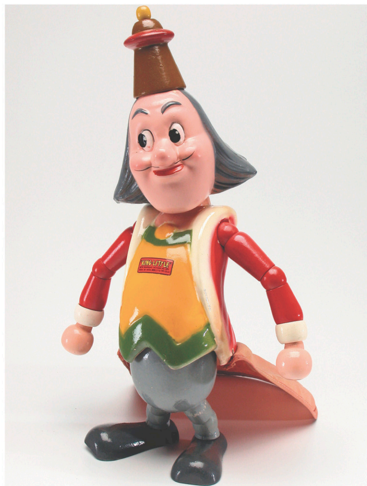
Poupée King Little (1939)

des gens qui continueront à nous visiter. On veut leur montrer que les musées ne sont pas juste des zones poussiéreuses où on place des objets.»