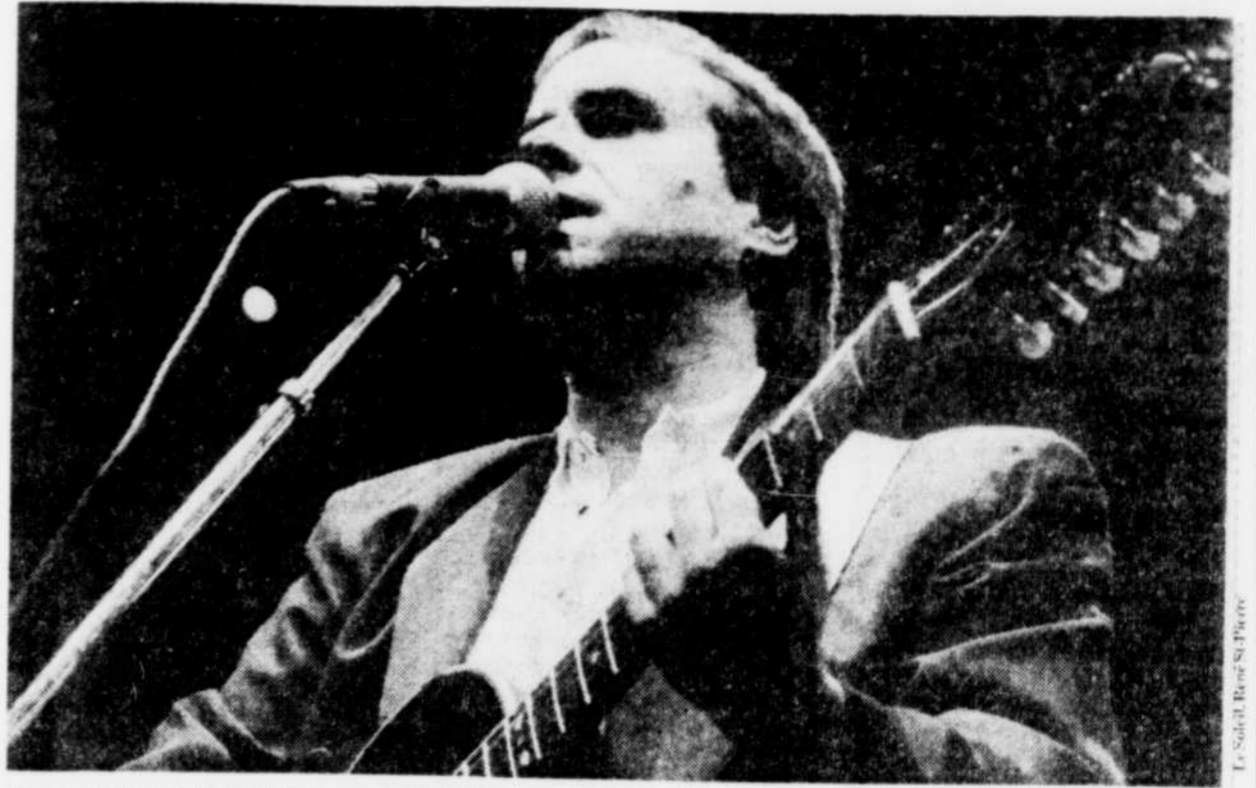
En peu de temps, le chanteur a conquis la foule.

La première partie de la soirée a été assurée par le chanteur britannique Black. Encore peu connu, ce dernier pouvait tout de