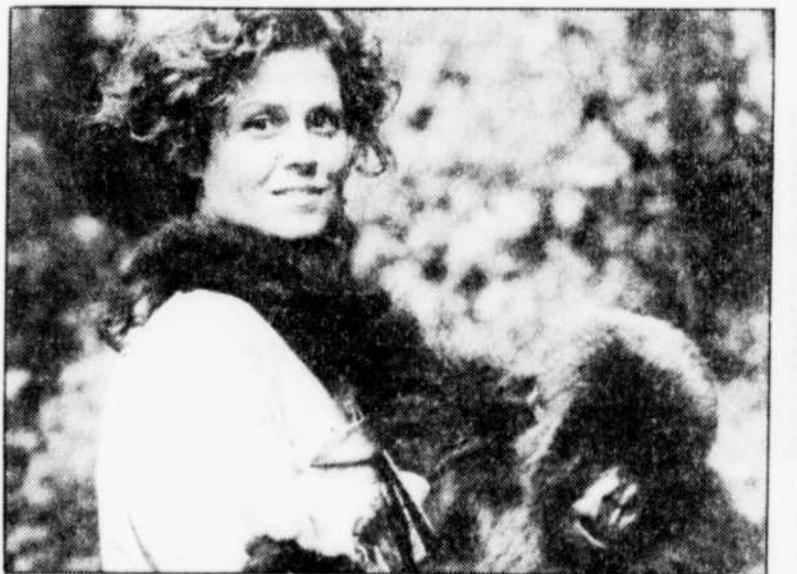
Autant Dian Fossey se fondait dans le monde de ses protégés, autant Sigourney Weaver s'identifie à son personnage.