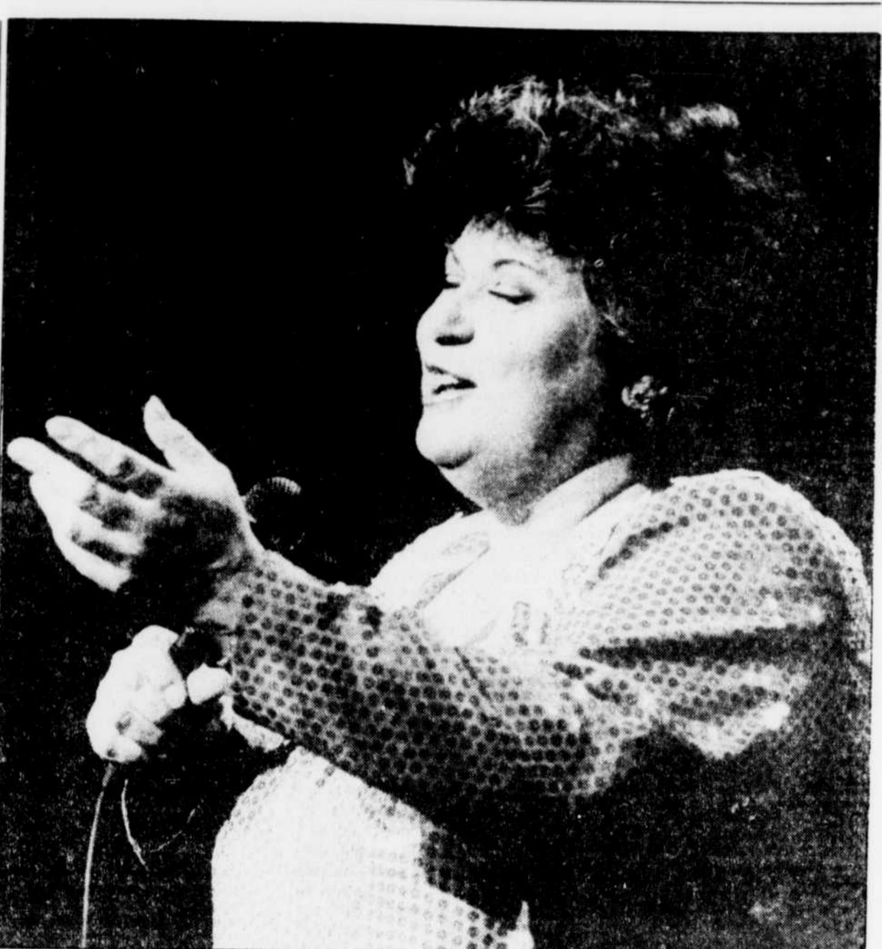
Ginette Reno propose un spectacle d'une grande intensité. Pour célébrer ses 30 ans de vie artistique, elle offre un véritable bouquet de chansons à son fidèle public. Elle est encore au Grand Théâtre ce soir et demain et reviendra du 20 au 23 et du 27 au 30 avril.

Willow (4) Américain 1988. Conte réalisé par Ron Howard. Int. Warwick Davis, Val Kilmer. Afin d'empêcher la naissance d'une fillette prédestinée à diriger le royaume, une cruelle reine enferme toutes les femmes enceintes de son village. Cependant l'enfant sera sauvée et trouvera un protecteur dans la personne d'un nain. (Clap)