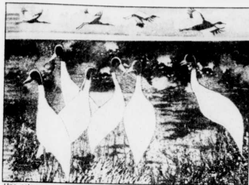
Une estampe caractéristique de Jeannine Bourret.