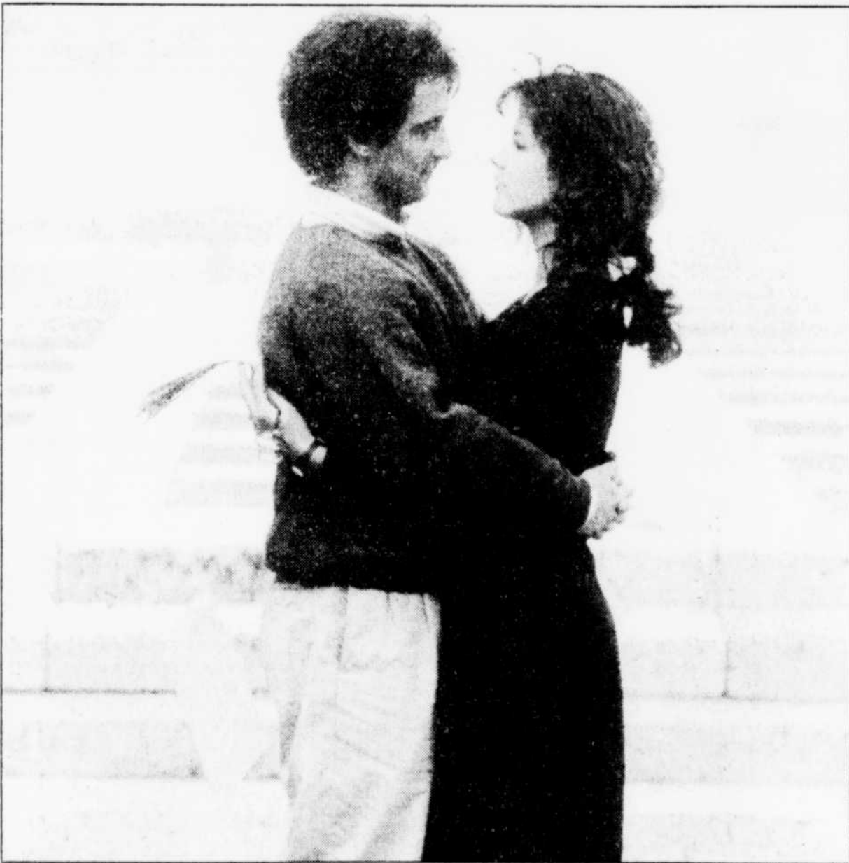
Sophie Marceau et Vincent Lindon dans une comédie amoureuse pleine de candeur.