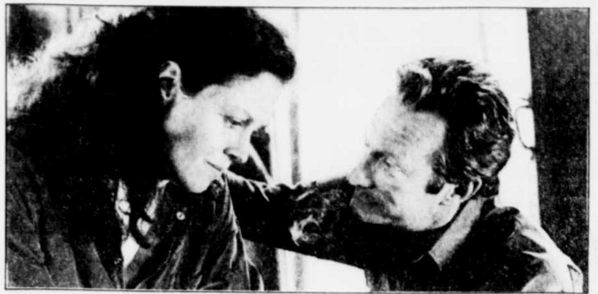
Sigourney Weaver et Bryan Brown dans « Gorilles dans la brume »