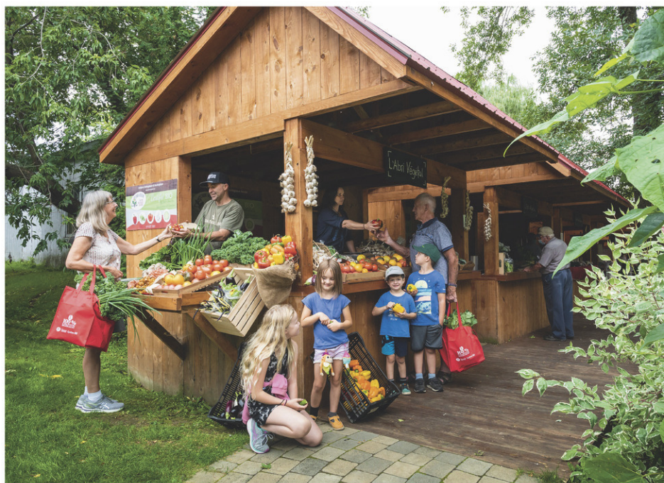
L'équipe du Marché de soir de Compton aimerait bien voir apparaître d'autres marchés publics dans la région.