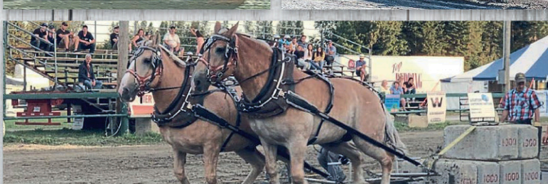
Tires de camions, tracteurs et chevaux