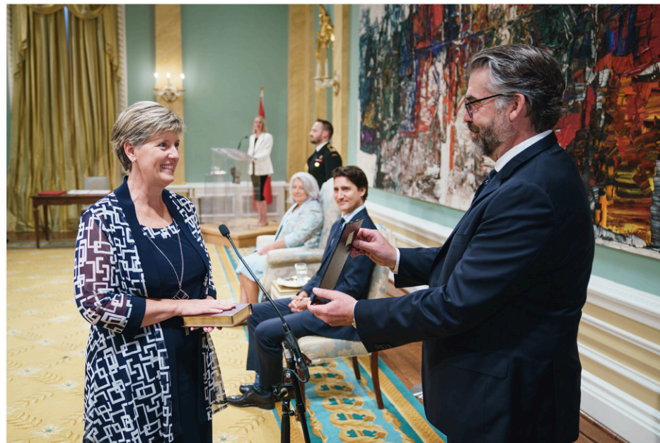
Marie-Claude Bibeau is sworn in as Minister of Revenue during a ceremony at Rideau Hall. July 26, 2023. // Marie-Claude Bibeau est assermentée à titre de ministre du Revenu durant une cérémonie à Rideau Hall. 26 juillet 2023.

Les rencontres, bien que différentes de celles effectuées à titre de ministre de l'Agriculture, seront aussi à l'agenda de M me Bibeau. « Je partirai sur la route pour voir les fonctionnaires qui sont dans de nombreux bureaux partout à travers le pays. Je veux aussi venir en aide à