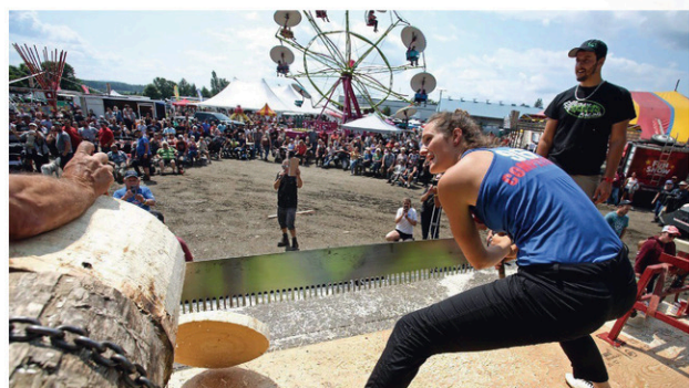
Les compétitions de bûcherons ont attiré l'attention de nombreux curieux.

L'Expo Vallée de la Coaticook a attiré un peu plus de 13 500 visiteurs le week-end dernier (4 au 6 août).