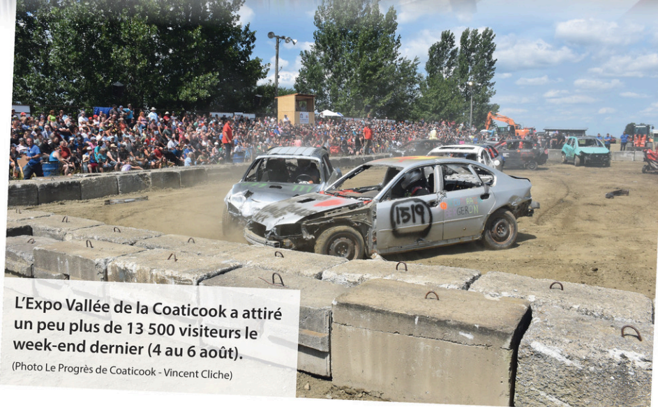
L'Expo Vallée de la Coaticook a attiré un peu plus de 13 500 visiteurs le week-end dernier (4 au 6 août).