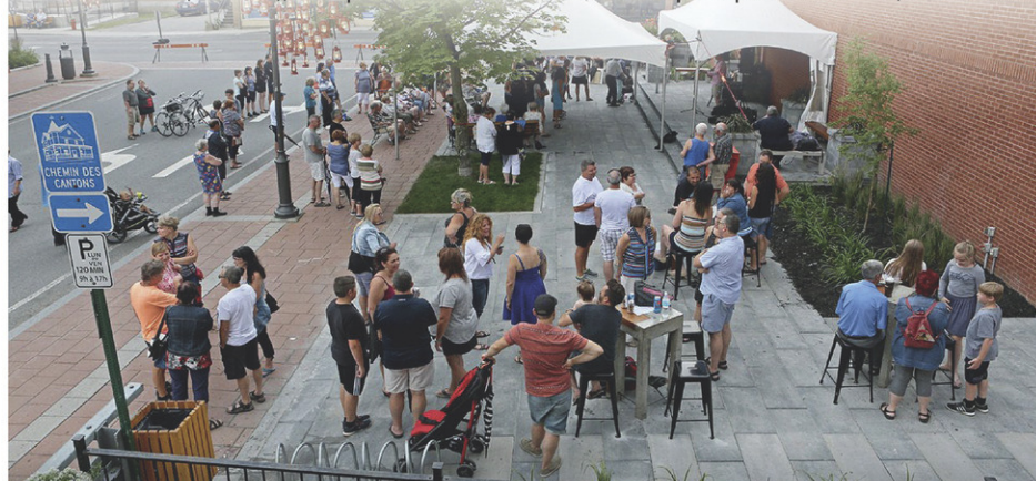
Le centre-ville de Coaticook célébrera la rentrée avec la tenue d'un événement à saveur country, du 10 au 12 août.