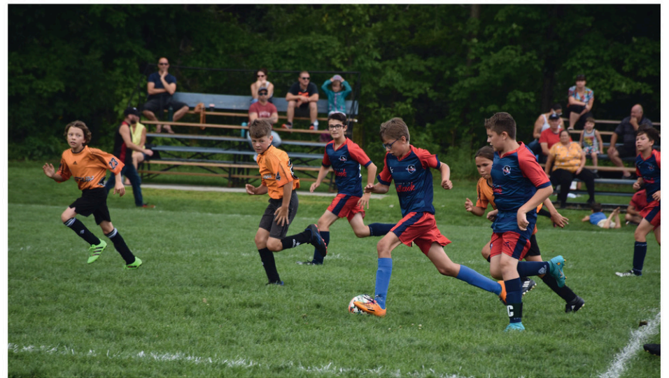
Au total, quatre formations de l'Éclipse Coaticook-Compton ont participé au Tournoi des frontières, qui s'est tenu le week-end dernier, du 12 au 14 août.

Notons que les finales du tournoi auront lieu le dimanche (13 août) sur deux sites, soit ceux du parc Laurence et de La Frontalière.