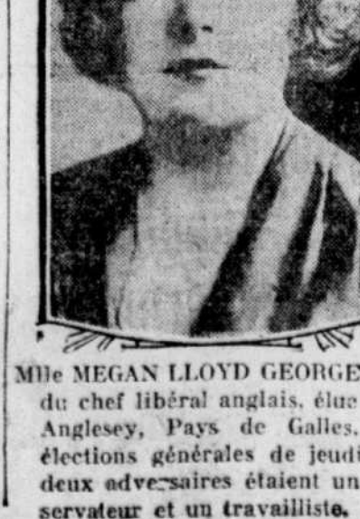
Mlle MEGAN LLOYD GEORGE, fille du chef libéral anglais, élue dans Anglesey, Pays de Galles, aux élections générales de jeudi. Ses deux adversaires étaient un conservateur et un travailliste.

Adressez-vous au Service de librairie du "Devoir", 430 rue Notre-Dame est, Montréal. (Téléphone: Harbour 1241)