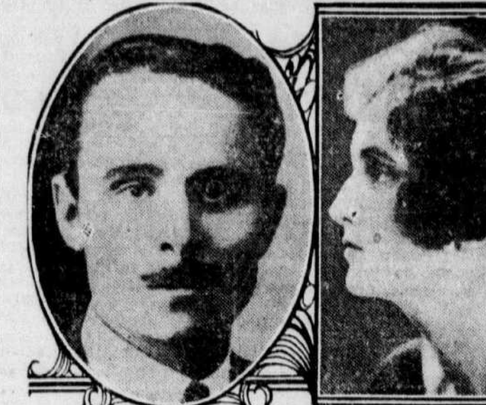
SIR OSWALD MOSLEY ET SA FEMME LADY CYNTHIA MOSLEY, élus tous deux comme travaillistes aux élections de jeudi en Angleterre.