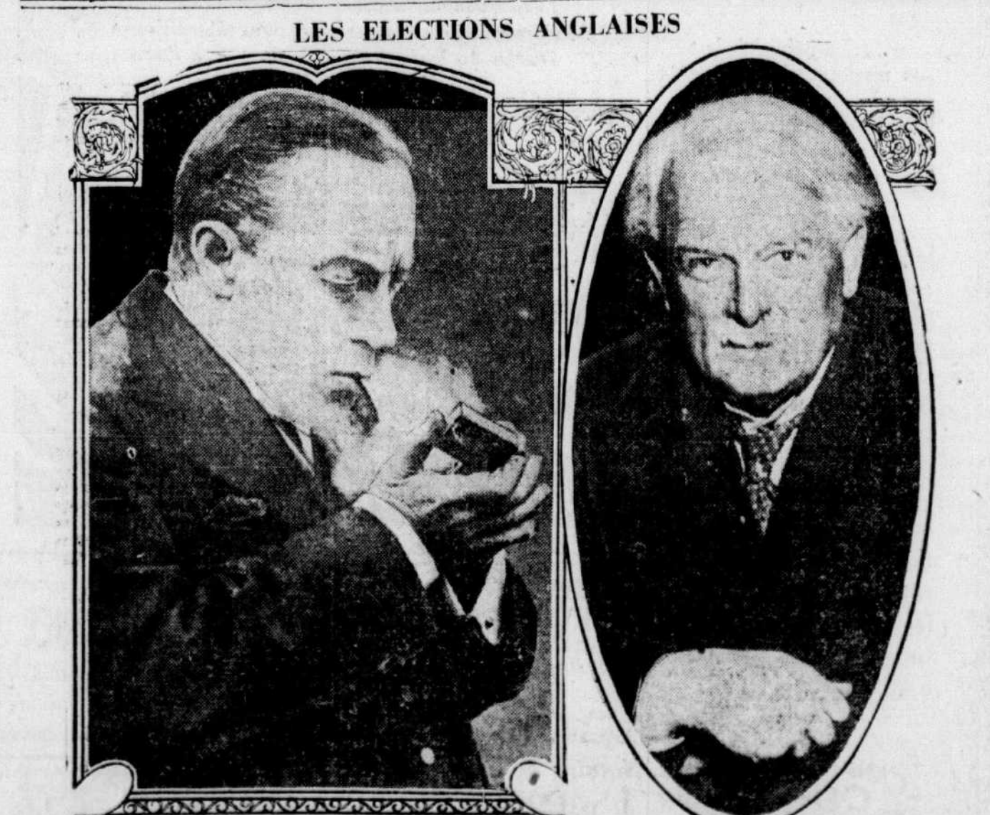
M. STANLEY BALDWIN, chef des conservateurs, (à gauche) a été réélu dans la division de Bewdley par une majorité de 14,018. M. DAVID LLOYD GEORGE (à droite) chef des libéraux, a été réélu dans Carnarvon, pays de Galles. Le parti conservateur a remporté 254 sièges sur 615, aux élections de jeudi, et le parti libéral, 57.