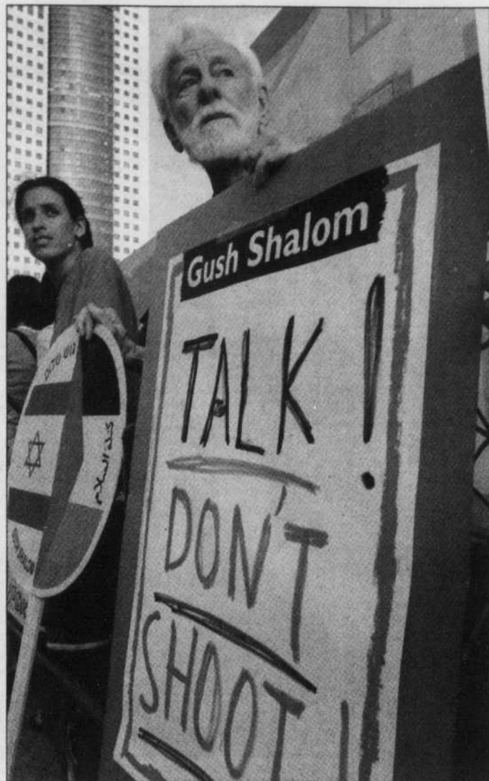
Des Israéliens de gauche ont manifesté hier devant le ministère de la Défense à Tel-Aviv pour dénoncer l'offensive de Tsahal en territoire palestinien.

Par ailleurs, plusieurs avions militaires ont survolé hier les palais du président syrien Bachar el-Assad pour avertir la Syrie qu'elle ne doit en rien soutenir les Palestiniens qui ont enlevé Gilad Shalit, a fait savoir l'armée israélienne. Les dirigeants israéliens accusent Khalid Mechaal, chef du bureau poli-